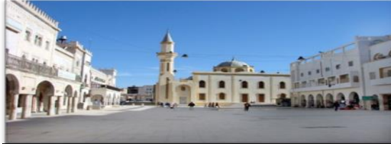
صورة (١) المسجد العتيق