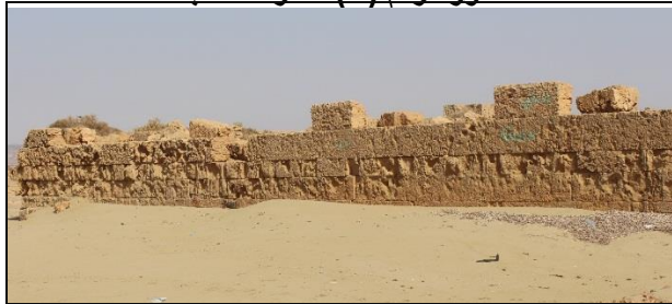
صورة رقم (٧) قصر المطنب