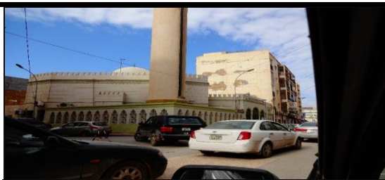
صورة (٣) جامع بوغوله