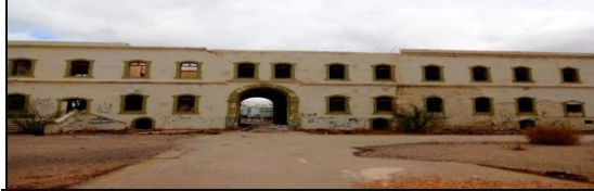
صورة رقم (٥) قصر البركة