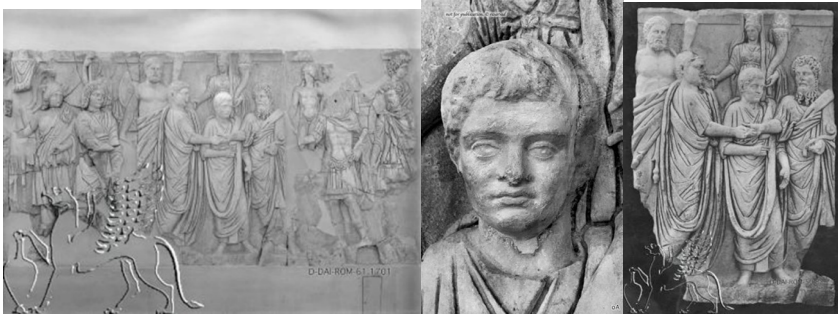
الشكل 6 نقش بارز - قوس سبتمبيوس سفيروس - المتحف الأثري في طرابلس - ليبتيس