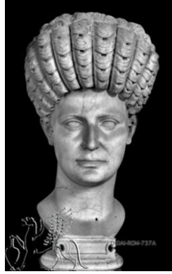
الشكل 2 رأس لسيدة متحف الفاتيكان-- No. 1351- الرخام - 53.5 سم