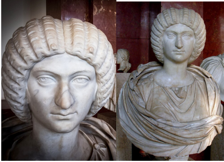
الشكل 5 جذع الإمبراطورة جوليا دومنا - اللوفر Ma 1103 - الرخام 84-سم