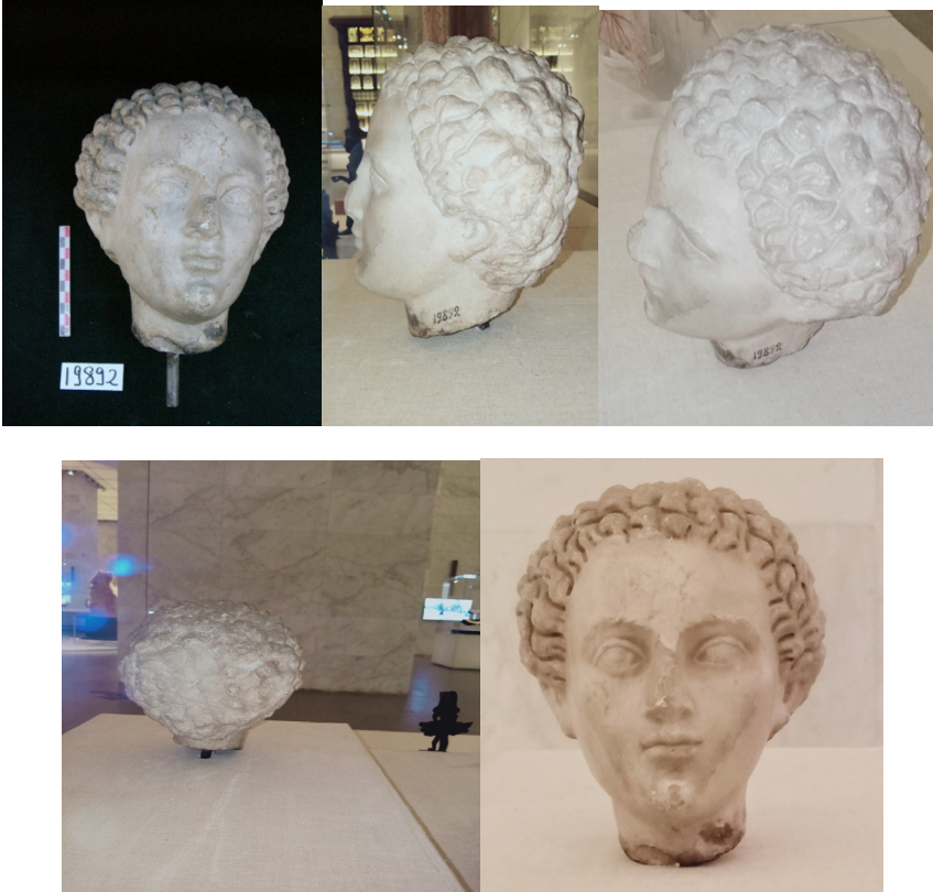
الشكل 1 رأس لشاب بداية القرن الثالث الميلادي - متحف الحضارة - الرخام No.