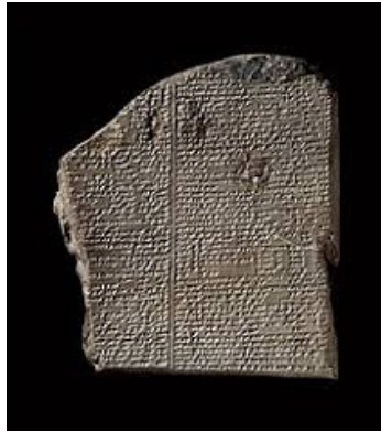
الشكل رقم (1) ملحمة جلجامش

هكذا كان يرى العراقيون القدماء سكان المناطق الجبلية الذين كانوا مصدر قلق وتهديد لهم ولأمنهم، وما سبق مثال لواحد من أنواع الأدب ذكرت الجبال بها، ذكر العراقيون الجبل بشتى تأثيراته كموقع جغرافي وكإله ومصدر تهديد بسبب قاطنيه، ويرجع ذلك للمكانة التي حظي بها الجبل ومدى تأثيره في تاريخ وحضارة العراق القديم.