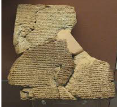
الشكل رقم (2) ملحمة الطوفان