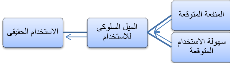
شكل رقم (١) يوضح نموذج قبول التكنولوجيا TAM

عن توقعات الشخص بأن استخدامه للتكنولوجيا سيفيد بتحسين أداء مهامه، كما عرف سهولة الاستخدام المتوقعة بأنها الدرجة التي يعتقد الشخص أن استخدام نظام معين سيكون بقليل من الجهد.