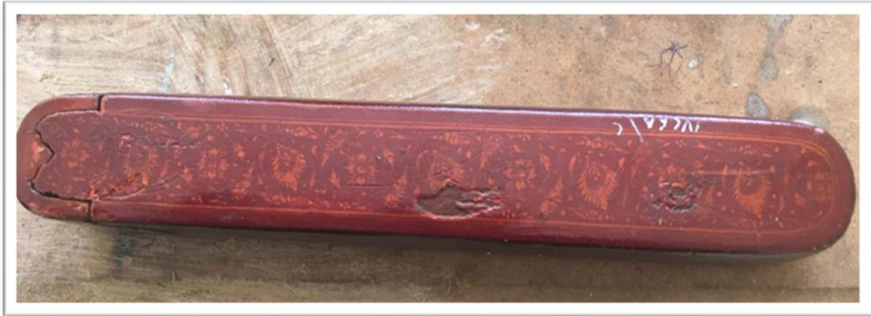
اللوحة (٤)