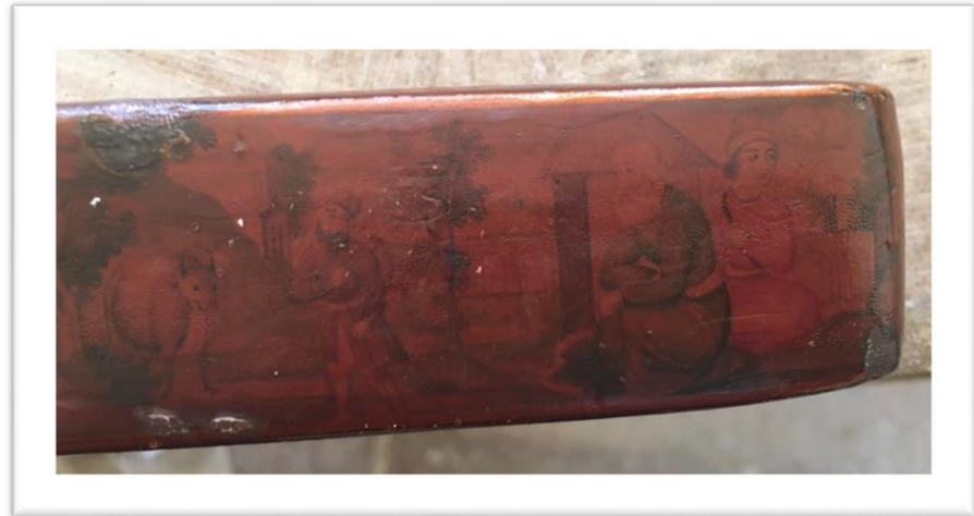
اللوحة ٢-ج