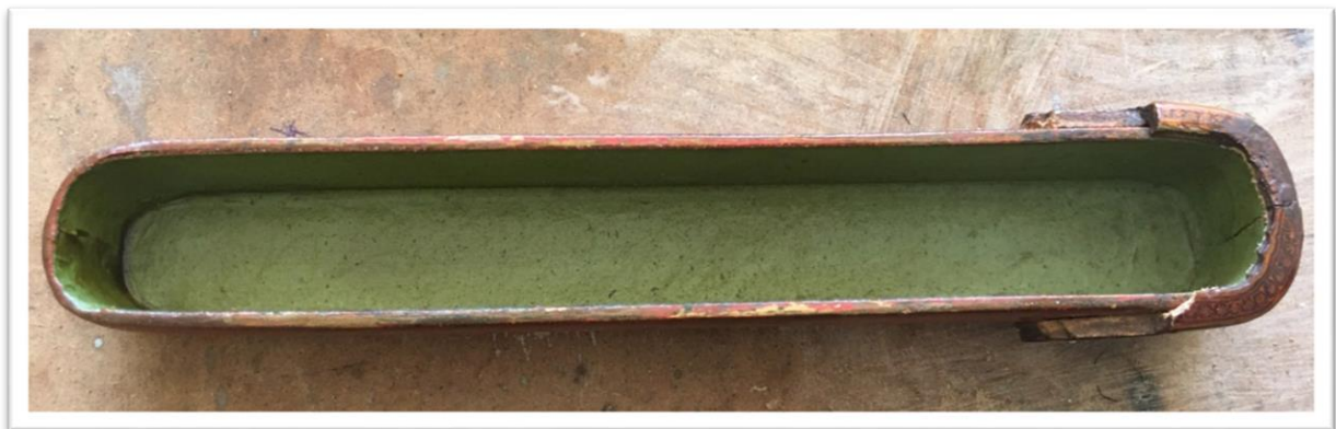
اللوحة (٦)