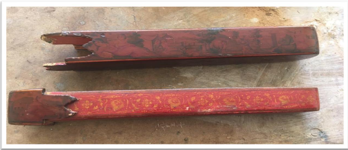
اللوحة (٥)