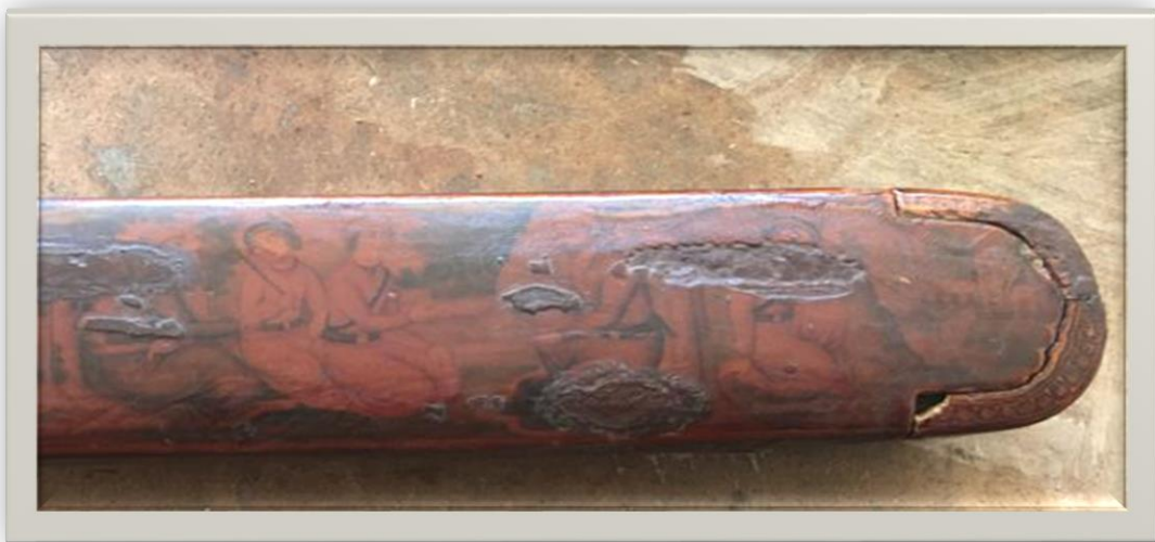
اللوحة ١-ج