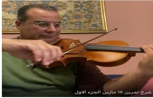
شرح تمرين ١٥ مازيس الجزء الاول