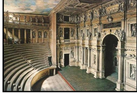
شكل (٦) مسرح سيرليو - عصر النهضة الأوروبية - ١٥٣٠ م نقلًا عن Castle-Ckrumlov (١)