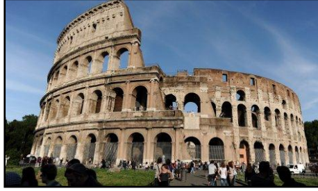
شكل (٣) يوضح المسرح الروماني

إلى فن العمارة نوعاً من الهندسة المعمارية الزخرفية وذلك بتصميم الأقواس التي تتميز بها بناء مسارحهم (١) ، ومن الملاحظ الملاحظ أن الرومان لم ينشئوا مسارحهم على سفوح التلال كما كان يفعل الإغريق بل أقاموها على أرض مستوية وذلك لكي تظهر فخامة المبني وزخرفته من الداخل والخارج يوضح شكل (٣) المسرح الروماني.