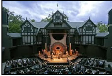
شكل (٤) المسرح الإليزابيثي

اتسمت الحركة المعمارية بالإقبال على بناء الدور المسرحية المتعددة، وفي بادئ الأمر كان المسرح دائرة الشكل ثم اتخذ شكلاً سباعياً مرتفعاً ثم أصبح مبني متعدد الأضلاع من سبعة إلى ستة عشر ضلعاً - يستوعب ثلاثة طوابق لجلوس النظارة، وكانت أضلاعه مغطاة بجمالون من الإردواز لحماية النظارة من التقلبات الجوية، في حين كان باقي المسرح غير مسقوف" (١). انظر شكل (٤) مسرح الإليزابيثي.