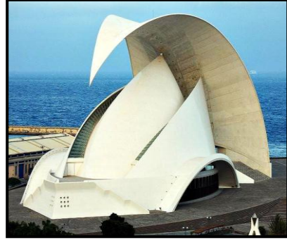
شكل (١٤) سينوجرافيا الفضاء المسرحي (الفراغ الداخلي) لصالّة مسرح جزر الكناري Canary islands - ٢٠٠٣ - في أسبانيا - نقلاً عن : www.discover.hubpages.com . (٣)