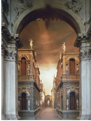
شكل (٧) سينوجرافيا الفضاء لمسرح البلاط في عصر النهضة (٢)