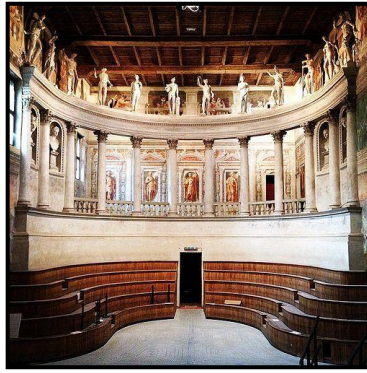
شكل (٨) سينوجرافيا الفضاء لمسرح سايبونيتا بإيطاليا (٣)

وتستخلص الباحثة أن فترة عصر النهضة على مستوى جميع البلدان التي ظهرت فيها، وعلى وجه التحديد إيطاليا - بصفتها المهد الحقيقي لفناني تطور النهضة والمسرح - قد