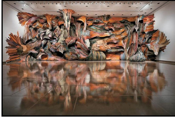
شكل رقم (٤)