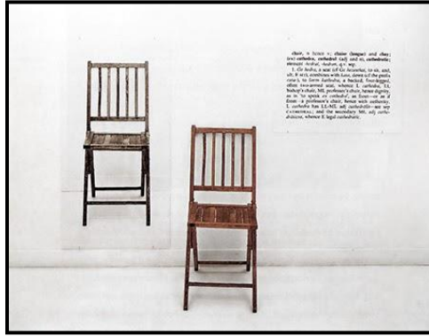
شكل (١) الفنان "جوزيف كوست Joseph Kosut" ١٩٦٥

من أفضل الأعمال المعبرة عن الفن المفاهيمي عمل الفنان "جوزيف كوست Joseph Kosut" كما يتضح في الشكل (١).