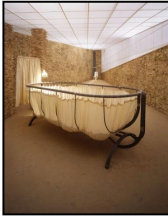
شكل رقم (٥)

كما استخدم الفنان "هاميلتون A. homilton" الوسائط العضوية بشكل أساسي في موضوع العمل إلى جانب استخدامه للوسائط سابقة التجهيز كوسيط ثانوي، كما يتضح في الشكل رقم (٥).