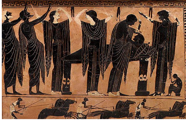
(شكل ٨) رسم توضيحي (تفصيلي) أعلاه: جرة زخرفية ، اليونان ، ٥٢٠ قبل الميلاد توضح الشعائر الجنائزية لاحد الموتى.

ويرصون حزم بعد أن يتم وزنهم. وقد اهتم الفنان اليوناني القديم بتعظيم شخصية الملك بان جعله أكبر من غيرها من الرجال، مما يدل على مكانته ، والمشهد هو مثال على الأحداث التي تجري في الحياة العادية وتحية لحكمة الملك وسلطته. (شكل ١٠)