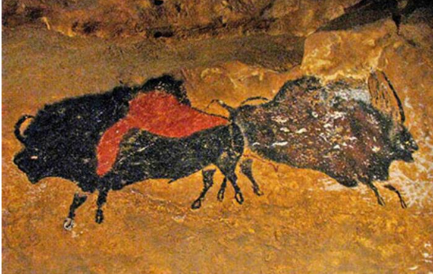
(شكل ٢) رسم توضيحي لثوران - كهوف لاسكو -جنوب فرنسا - ١٣٠٠٠-١٥٠٠٠ قبل الميلاد - و يتضح كيف استطاع الانسان البدائي اظهار ملمس الفراء على حسم الثور

في كهف Chauvet-Pont-d'Arc في نفس المنطقة ، استخدم الفنانون ملامح الجدار للمساعدة في تشكيل إحساس ثلاثي الأبعاد للحيوانات المتحركة. ويعتقد أن هذا الفن قد خدم غرض الشامانية أو السحرية في نوع من الطقوس. ربما تم صنع الصور من أجل ضمان النتيجة الناجحة لمطاردة. ربما كان هناك القليل من التمييز بين الصورة والواقع: من خلال توضيح صورة الحيوانات التي تم قتلها ، قد تصبح قوة حياتها الفعلية أكثر عرضة للخطر. (شكل ٣ )