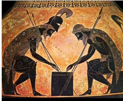
(شكل ٩) حاويات زخرفية مرسومة بمنظر شخصية. يصور أحدهما أخيل وأياكس ، وهما أكبر محاربيين يونانيين ، وهما يلعبان لعبة الطاولة خلال فترة انقطاع في حصار طرواده في عام ٥٦٠ قبل الميلاد - صنع الخزاف اليوناني