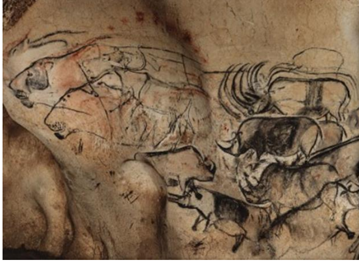
(شكل ٣) رسم توضيحي لمجموعة من الحيوانات المتحركة - كهف Chauvet-Pont-d'Arc -جنوب فرنسا - ١٣٠٠٠-١٥٠٠٠ قبل الميلاد - و يتضح كيف استطاع الانسان البدائي استخدام ملمس الجدار لأظهار شكل ثلاثي الابعاد للحيوانات المتحركه