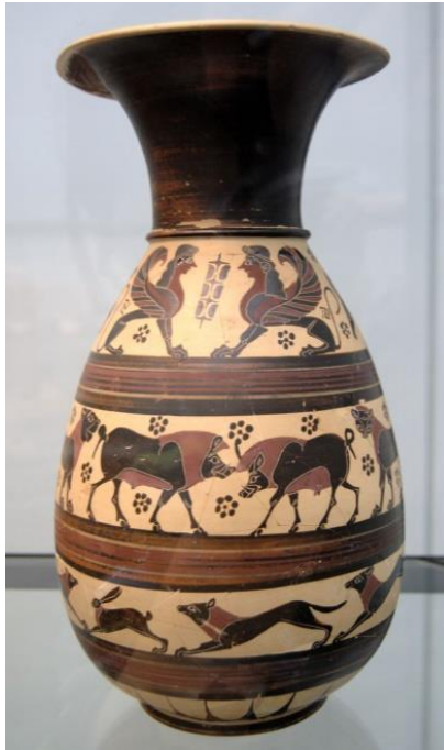
شكل (٧) جرة من الفخار مدون عليها رسومات متتابعة لحيوانات كالثيران و الالارانب البرية و كلاب الصيد -٦٢٠٠ ق.م

مواطن وهياكل تقيم فيها على سطح الأرض ، كل هذه قد فتحت أمام اليونان آفاقاً واسعة للنحت والعمارة ولعشرات العشرات من الفنون المتصلة بهما. ولسنا نجد ديناً غير هذا الدين - مع جواز استثناء الديانة المسيحية الكاثوليكية - شجع الآداب والفنون ، وأثر فيهما ، كما شجعهما وأثر فيهما الدين اليوناني." (١) شكل (٧)