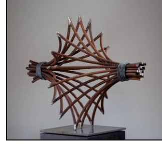
شكل (أ-٣) goes around comes around

- ونستنتج من شكل ( أ - ٦ ) تكوين خطي غير منتظم ويتخذ مساراً هندسياً علي شكل ( شبيه منحرف) والشكل علي هيئة بورتريه. [الهندسية العضوية].