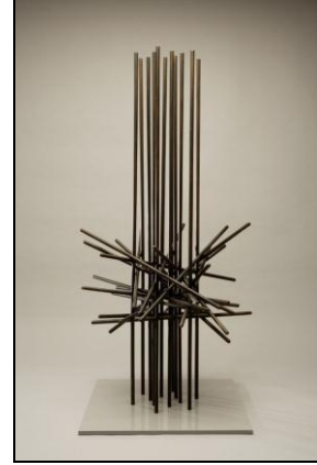
شكل (١-أ) Memorial