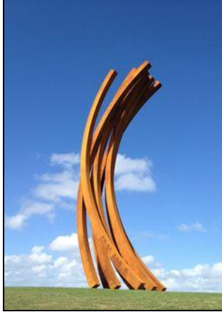
شكل (٢-أ) Gibbs Farm