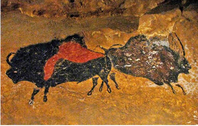
(شكل ٢) رسم توضيحي لثوران - كهوف لاسكو -جنوب فرنسا - ١٣٠٠٠-١٥٠٠٠ قبل الميلاد - و يتضح كيف استطاع الانسان البدائي اظهار ملمس الفراء على جسم الثور

في كهف Chauvet-Pont-d'Arc في نفس المنطقة ، استخدم الفنانون ملامح الجدار للمساعدة في تشكيل إحساس ثلاثي الأبعاد للحيوانات المتحركة. ويعتقد أن هذا الفن قد خدم غرض الشامانية أو السحرية في نوع من الطقوس. ربما تم صنع الصور من أجل ضمان النتيجة الناجحة لمطاردة. ربما كان هناك القليل من التمييز بين الصورة والواقع: من خلال توضيح صورة الحيوانات التي تم قتلها ، قد تصبح قوة حياتها الفعلية أكثر عرضة للخطر. (شكل ٣)