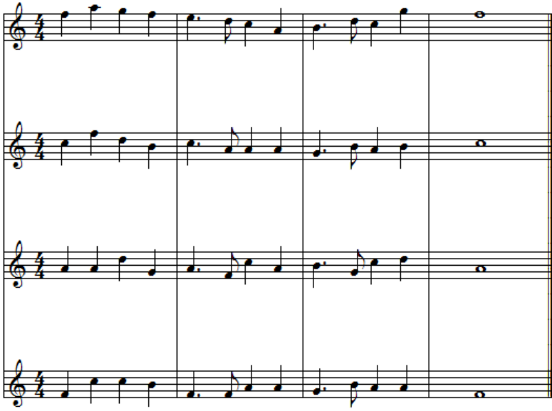
شكل رقم (١١)