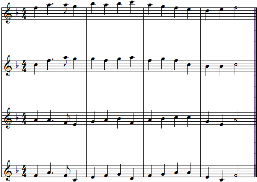
شكل رقم (١٢)