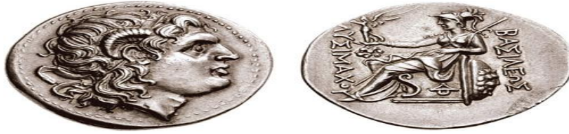
صورة رقم (3)

https://www.gettyimages.com/detail/news-photo/ancient-greek-silver-coin-295-bc-dimension-diameter-31-news-photo/973838734?adppopup=true