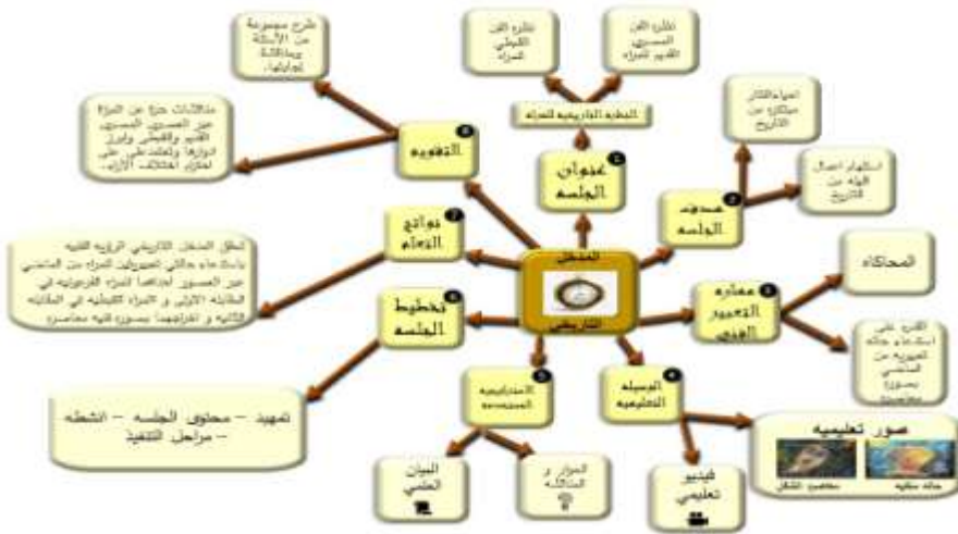
شكل (3) خريطة ذهنية توضح العلاقة بين المدخل التاريخي و نواتج التعلم

٤- خرائط ذهنية تربط بين نواتج التعلم والمداخل التدريسية كما في شكل من (٣:٨) من تصميم الباحثة :