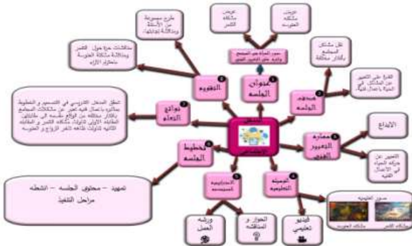
شكل (4) خريطة ذهنية توضح العلاقة بين المدخل الاجتماعي و نواتج التعلم