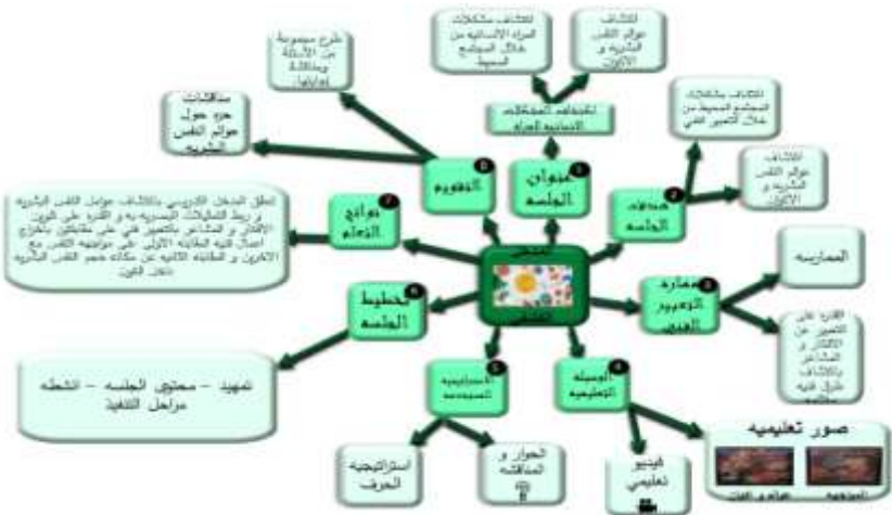
شكل (6) خريطة ذهنيه توضح العلاقه بين المدخل البصري و نواتج التعلم