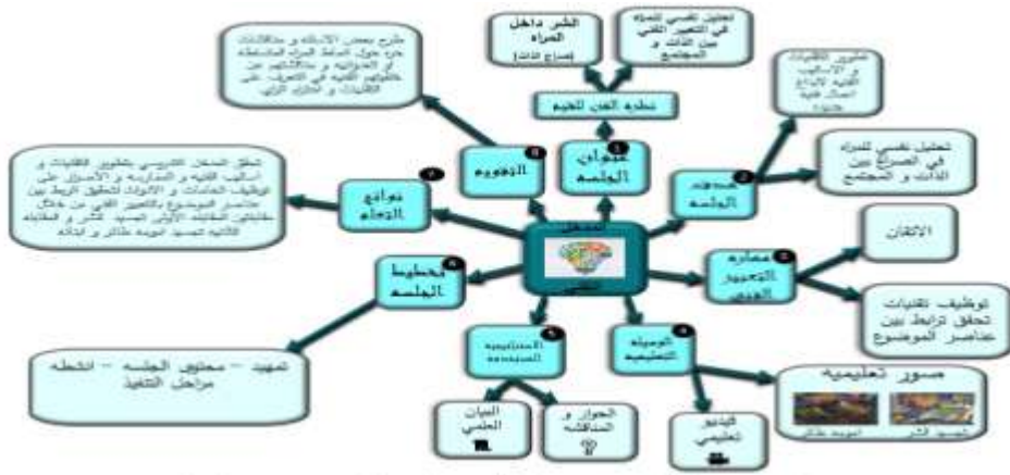
شكل (7) خريطة ذهنيه توضح العلاقة بين المنهل التجريبي و نواتج التعلم