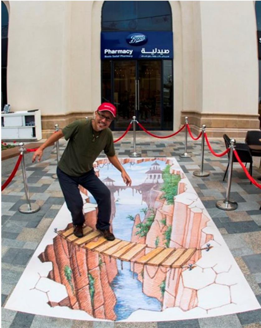
(شكل ٤) عمل أفقي ثلاثي الأبعاد للفنان Tomotero ، لمهرجان Dubai Canvas ، مدينة دبي، بالإمارات العربية المتحدة ، ٢٠١٧م.

المارة ويظهر ذلك بوضوح في (شكل ٤) فهو عبارة عن عمل فني بمهرجان دبي "Dubai Canvas" ٢٠١٧م ، قام الفنان بتحويل أرصفة وأرصيات الشوارع المملة بدبي إلى جدارية أفقية ثلاثية الأبعاد تكاد تنبض بالحياة ، وقام بإثراء التراث الفني لها متخيلاً حفرة ثلاثية الأبعاد على أحد أرصفتها حيث رسم فكرة مستوحاة من عناصر خلق الحياة مثل الماء أو مشهد لجسر فوق أرضية الساحة العامة تشكلت بفعل إنهيار جرف صخري مصور بأسلوب الخداع البصري المموه ، مما سمح للمندوبين والزائرين لها بتجربة التفاعل مع التكوين ثلاثي الأبعاد كشكل فني فريد ، كما يجب على المشاهدين أن ينظروا إلى العمل الفني من وجهة نظر معينة ، حيث أن الصورة نفسها ممتدة أفقياً بشكل تام ويتم تشكيلها بعمق و إحياء إيهامي بالمنظور لتحقيق الإحساس المجسم للعناصر ثلاثية الأبعاد ، فلا يمكن للمشاهد التعرف التام على أعمال الفنان "Tomotero" على حقيقتها إذا نظر إليها من الجانب نظراً لكونها صورة متعددة الأوجه .