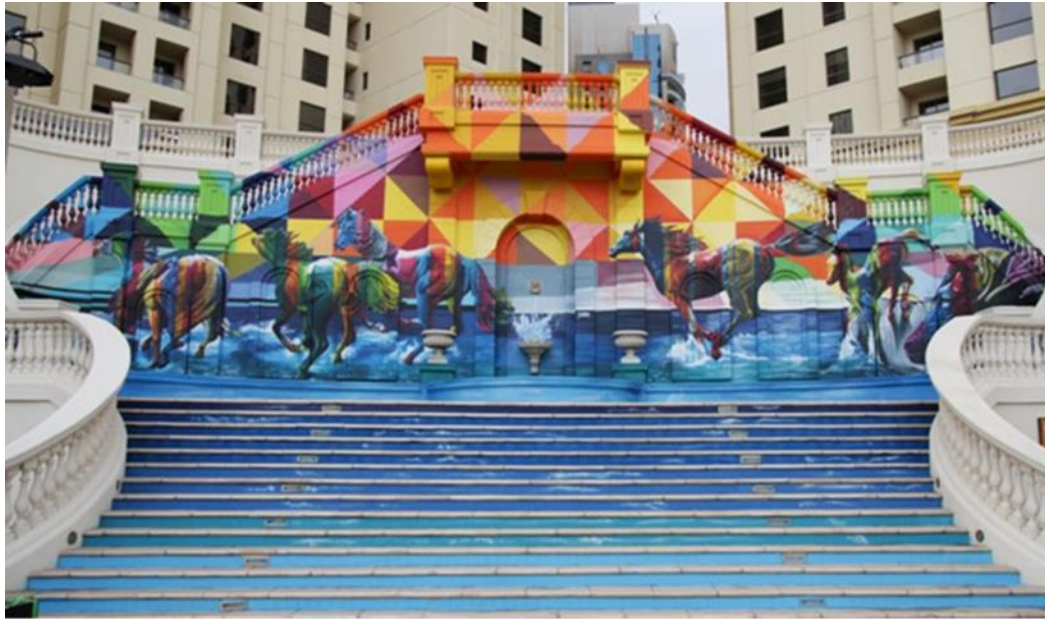
(شكل ٢) عمل جداري للفنان Eduardo Kobra ، أسطورة الجواد العربي "The Legend Of The Arabian Horse" ، لمهرجان Dubai Canvas ، مدينة دبي، بالإمارات العربية المتحدة ٢٠١٧م.

ومن أهم أعماله جدارية مهرجان دبي كانفاس "Dubai Canvas" والتي قام بتنفيذها في عام ٢٠١٧ (شكل ٢) ففي هذه الجدارية تناول كوبرا "Kobra" الواقع المفرطه بشكل دقيق ومفصل للغاية حيث يصور عمله مجموعة من الخيول في حالة حركة وسباق على البحر، ثم قام بمزجها بالأشكال الهندسية التجريدية مثل الدوائر والمثلثات والمربعات والتخطيط الشبكي المنهجي في خلفية متعددة الألوان وتأثيرات الظلال والإتجاهات الدوامية ، كما أستخدم في تنفيذها مزيج من تقنيات متنوعة بما في ذلك الرسم بمزيج من علب الهباء الجوي وعبوات البخاخة "Aerosol" والفرشاة والألوان النابضة بالحياة والخطوط الجريئة ، علاوة على ذلك عمل كوبرا "Kobra" بنظام ألوان محدد يشبه قوس قزح تقريباً فيظهر العالم الذي يدخله المشاهد متقلّباً ليبدو له في نهاية الأمر كما لو كان متماثلاً ، وبذلك عمل على تحقيق الصورة الواقعية مع الحفاظ على مظهرها الأنيق وألوانها الغنية ، وكانت الرسالة الأساسية التي يريد الفنان بثها من خلال هذا العمل هي مكافحة التلوث والاحتباس الحراري وتدمير الغابات.