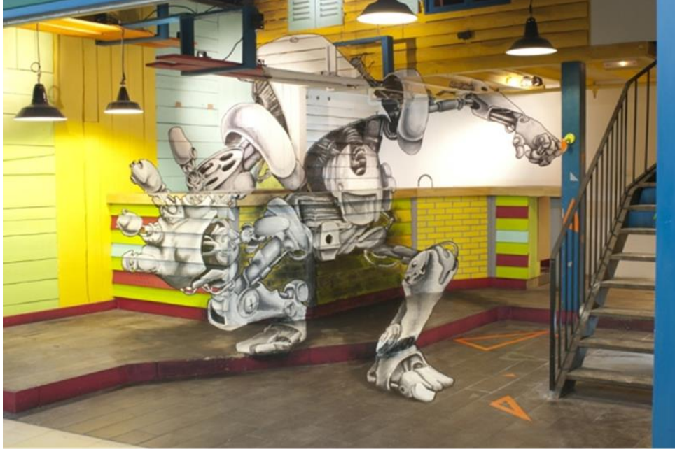
(شكل ٨) عمل جداري للفنان Milouz ، مهرجان Dubai Canvas ، في مدينة دبي، بالإمارات العربية المتحدة ، ٢٠١٧م.

والتظليل مسترشداً بغريزته الفنية، والتي ساعدته في إنشاء هذا التراكيب المدروس بعناية وبإحساس مذهل بالعمق المكاني ، كذلك تتألق روح الدعابة لدى ميلوز "Milouz" في الطريقة التي صور بها هذا المخلوق حيث تم رسمه أيضاً ليبدو وكأنه تهديد خطير ينبثق من زوايا الجدران المظلمة المنسية وفي أحيان أخرى يبدو هذا المخلوق كعملاق لطيف يضيء نوع من المرح والبهجة على المكان.