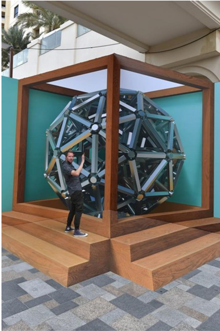
(شكل ٥) عمل جداري للفنان Leon Keer ، لمهرجان Dubai Canvas ، مدينة دبي، بالإمارات العربية المتحدة ٢٠١٧م.

فغالبًا ما يقدم فنه من خلال إضافة تقنيات جديدة ، مثل الواقع المعزز ورسم خرائط الفيديو ، كما يتميز عمله بقضايا الساعة بما في ذلك المخاوف من المخاطر البيئية الحالية، كما ينشر الفنان الهولندي باستمرار في جدارياته حس المرح والجمال من حوله مقارنة بالتدهور الطارئ في الواقع الحياتي، وهو التناقض الذي يعبر عنه ويقوم بتوظيفه في عمله، عاد ليون "Leon" مؤخرًا إلى دبي للحصول على إصدار آخر من دبي كانفاس "Dubai Canvas" من خلال عمل فني جداري جديد (شكل ٥) حيث يعكس ليون "Leon" في هذا العمل أفكاره ، ويواجه المشاهد بروح عصرنا المريضة، والإنحلال المرئي الذي يشير إلى الشوق الخالد للجمال ، فهو عبارة عن عمل فني يظهر بصورة ثلاثية الأبعاد بمزيج من تقنيات المنظور والوسائط الجديدة ، حيث أستخدم مجموعة متنوعة غنية من الوسائط ، بدءًا من دهانات الأكريليك الاحترافية إلى المواد اللاصقة والمذيبات والبرايمر والقطران ، كما يبدو أن الرسالة التي يريد توصيلها الفنان من خلال هذا العمل ، أن تتم مراجعة القضايا الحالية مثل المخاوف البيئية وقابلية العيش في هذا العالم