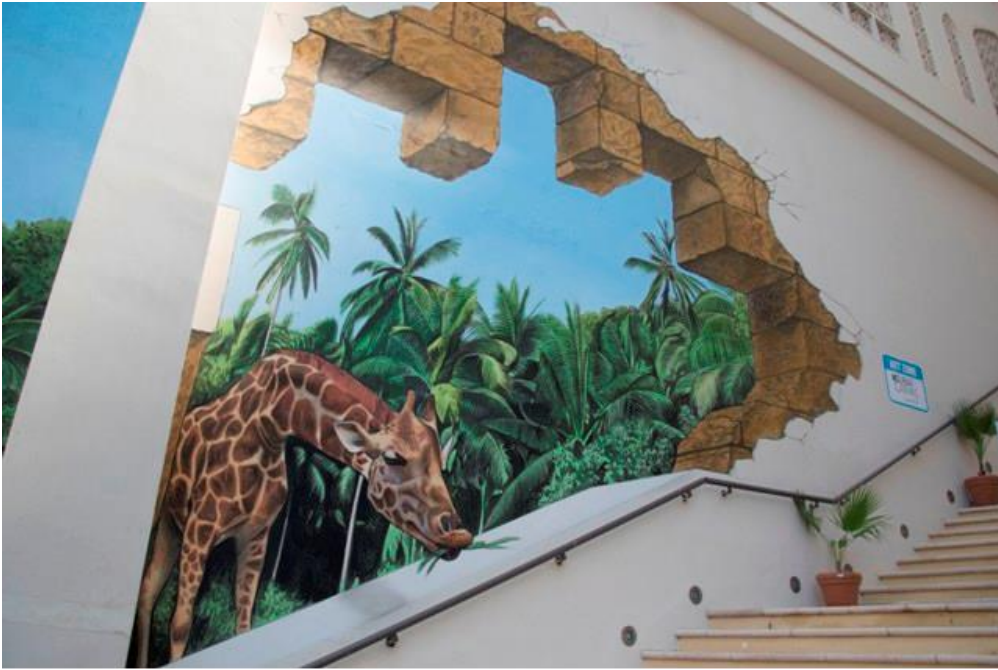
(شكل ٣) عمل جدارى للفنان "Juandres" ، لمهرجان Dubai Canvas ، مدينة دبي، بالإمارات العربية المتحدة ، ٢٠١٧م.

حضرية مثل الجداريات المؤقتة والدائمة في وضع ثنائي الأبعاد ووضع الصورة البصرية الموهبة (3D) في دول مثل الولايات المتحدة والمملكة المتحدة وإيطاليا وألمانيا وهولندا وبلجيكا وتايلاند والإمارات العربية المتحدة ودبي وإسبانيا وفي عام ٢٠١٧ شارك في مهرجان دبي كانفس "Dubai Canvas" بجدارية منفذه بأسلوب الواقعية المفرطة (شكل ٣) حيث قام الفنان بتحويله لواجهة زائفة كاملة بأسلوب الخداع البصري تضمن في أعلاها رسم جدار وكأنه متهاك ومنفجر بداخله مشهد لمنظر طبيعي من الريف ، كما تظهر أيضا من الأسفل رأس زرافة تخرج من المشهد وكأنها تتطل على الماره من نافذه شرفة ، كما قام بإعطاء الصور والأشكال في هذا العمل بعدا إيهاميا ثلاثي الأبعاد على أسطح الجدار المستوى، مما يمنح المارة وقفة للتفكير وتأمل الخداع البصري والعناصر المنفذه بأسلوب الإيهام البصري ، والتي تضيف عليها اللمسات والسمات المعمارية أو التصميمات الزخرفية المرافقة للمناظر والعناصر المصورة إحساساً بالتميز على المكان.