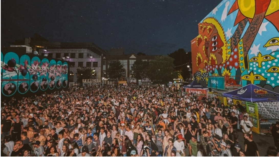
(شكل ١) مشهد يمثل حشود الزائرين الذين تجمعوا لمشاهدة فعاليات مهرجان التصوير الجداري بمدنتهم.

وفيما يلي دراسة لأحد أهم نماذج مهرجانات التصوير الجداري المعاصرة