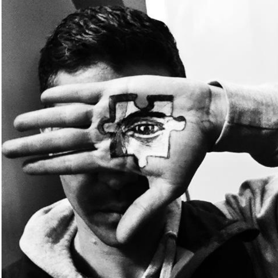
(شكل ٧) عمل جدارى للفنان kas ، لمهرجان Dubai Canvas ، مدينة دبي، بالإمارات العربية المتحدة ، ٢٠١٧ م .

في التعاون مع المشروع ، ثم يقوم بتوظيفها في لوحاته ودمجها بأسلوب سرىالى إلى حد ما مابين ما هو واقعى وماهو خيالى، حيث قام بإخفاء أجزاء من الوجه عن طريق اليد وقام بعمل رسوم عليها على شكل قطعة من ال puzzle ينتصفها عين البورتريه ، فتعطى صورة ثلاثية الأبعاد تجمع بين الواقعية وأنماط الألغاز والسريالية بها نوع من العمق من حيث اللون والموضوع والتفاصيل ، كما ساعدت على تغيير الصور الباهتة والمهملة والرمادية الموجودة على جدار المبنى من حيث الفكرة والإهتمام بالتفاصيل الدقيقة لإعطائه مستوى عالى من الكمال.