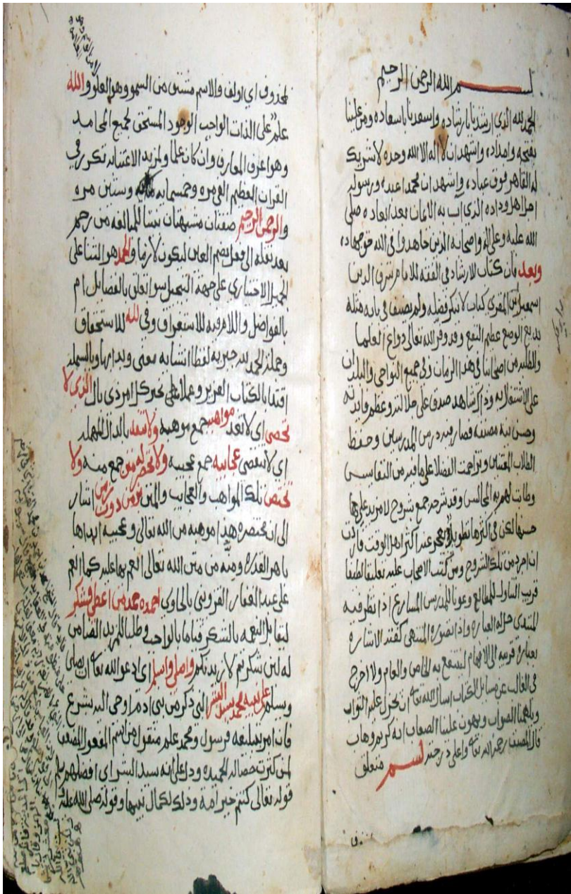
صورة الصفحة الأولى من المخطوط