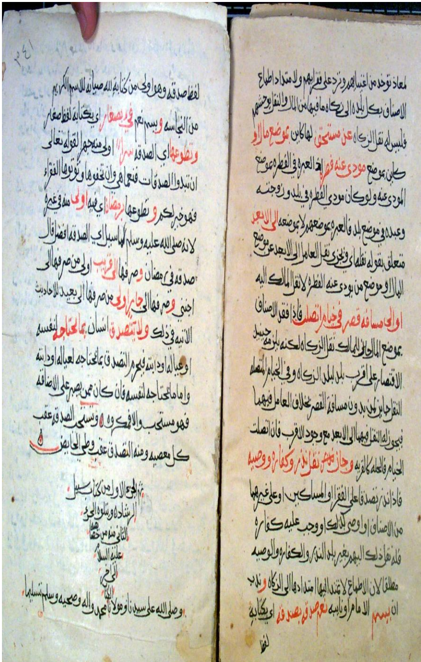
صورة الصفحة الأخيرة من المخطوط