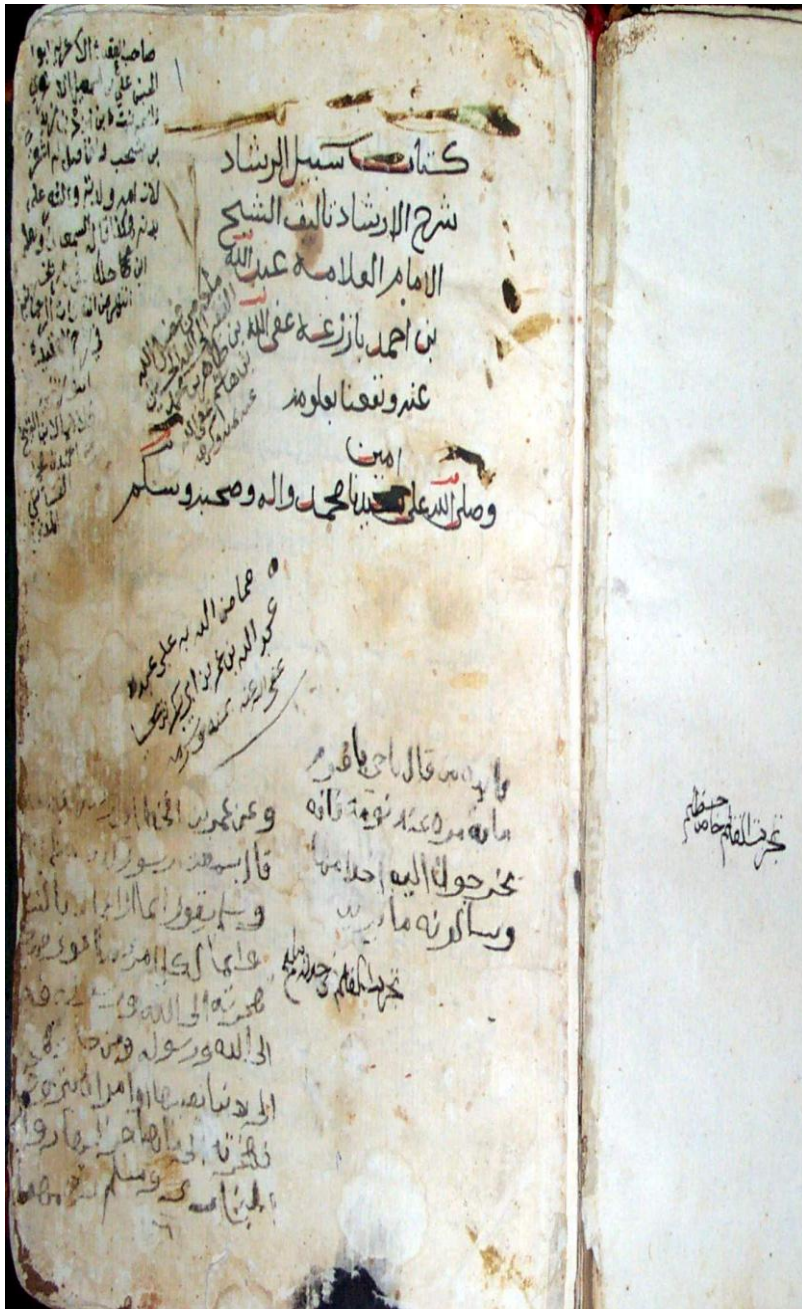
صورة الغلاف الخارجي للمخطوط