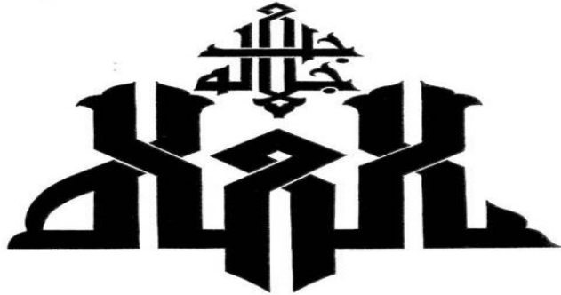
شكل رقم (١) الخط كوفي