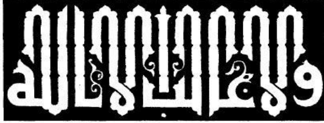
كوفي معماري بقلم الأستاذ محمد عبد القادر نصها : ( ولا غالب إلا الله )

نلاحظ هنا أن الحروف تتداخل وتتشابك، وتكون معقدة إلى حد ما، وقد يصل ذلك في بعض الأحيان إلى صعوبة قراءة النص، وربما لا يتمكن القارئ العادي من تحديد بداية ونهاية لكلمة