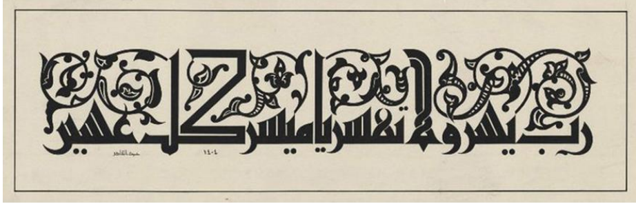
شكل رقم ( ٣ ) الكوفي المورق أو المزهر

يتكون من اتصال الأشكال النباتية ذات الأوراق أو الأزهار بكلمات الحروف في البداية أو الوسط أو النهاية، لتشكل معها الأشكال العامة لهذه الحروف. كما بالشكل رقم (٣)