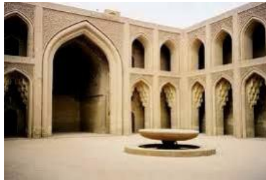
شكل رقم (٥)