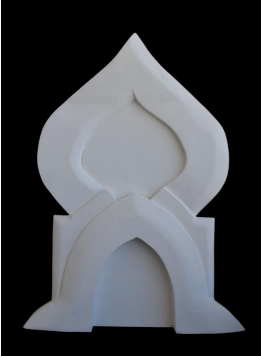
شكل رقم (٦) -مادة طلاء.mdf خامه العمل: خشب ابعاد العمل : ٦٥*٥٠

العمل رؤيه تشكيليه عمد الباحث من خلالها للاستلهام من العقود والاقواس الموجوده في العماره الاسلاميه القديمه وجاء العمل علي هيئه تكوين استخدم الباحث العقد البصلي في بناءه وتشكيله وقد حاول الباحث اضاء مضمون العمل بايجاز وبساطه وقد جاءت خطوط التكوين مستمده من ليونه المفرده في الطبيعه كما حاول الباحث الاستفاده من القيم الجماليه للعناصر المشكله للعمل من خلال تحقيق النسب والتناسب التي حققت قيم كل من الاتزان والحركه داخل التكوين والذي يحقق بذلك فرض البحث.