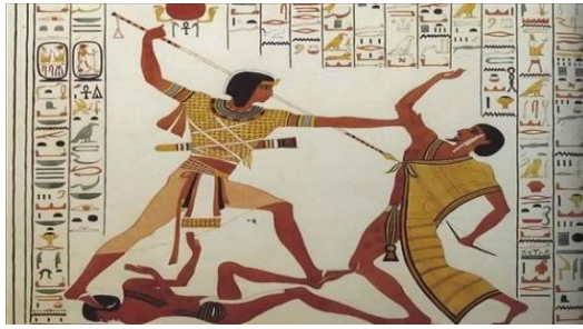
شكل رقم ( ١ ) الرماية في المصري القديم

واختلفت هذه الدراسة عن الدراسة الحاليه في "استحداث تشكيلات خشبية مجسمة من خلال صياغة المفردات المعمارية الإسلامية بالإفادة من برمجيات الكمبيوتر كما ان الدراسة الحاليه في مجال الفن التجريدي بينما هذه الدراسة في اشغال الفنيه . ومن الالعاب الرياضية في المصري القديم الرماية والتي اعتبروها قديماً رياضة الملوك قال الخبير الأثري عنها إن المصريون القدماء اعتنوا بها كثيراً كتدريب للدفاع عن الوطن ضد الغزاة والمجرمين، وأصبحت هذه الرياضة من الرياضات التي أول من مارسها ملوك مصر القديمة، وظهرت على جدران معبد "سيتي الاول بأبيدوس"، وأيضاً هناك صور تضم مجموعة من الرماة يتدربون على رياضة الرماية عن طريق استخدام القوس والسهم.