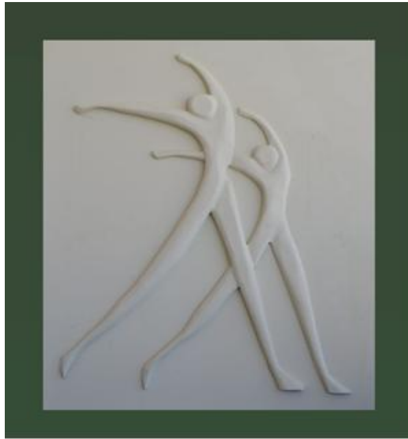
شكل رقم ( ٣ ) تطبيق ٢