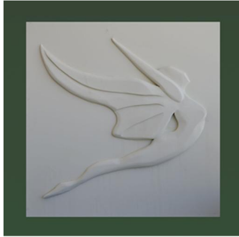
شكل رقم ( ٢ ) تطبيق ١