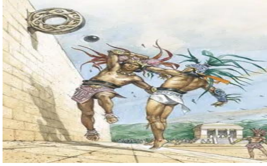
شكل رقم ( ٢ ) لعبة الكرة عند قبائل المايا

وفي القرون الوسطى تحول الجهد المعماري في بناء الكنائس بدلا من أماكن الترفيه والتسلية، وفي عصر النهضة لم يتم بناء صروح معمارية رياضية دائمة على الرغم من الاهتمام بالكلاسيكية والهندسة المعمارية للملاعب ومدرجات في نهاية القرن التاسع عشر انعكس تطور العلاقات الاقتصادية والثقافية بين الدول على تطور الرياضة فتأسس أول اتحاد رياضي دولي وتتنوع المسابقات فأقيمت دورات الألعاب الأولمبية الشتوية والأفريقية والآسيوية والعربية فأنشأت من أجل هذه المسابقات تجمعات رياضية خاصة تحتوي على أبنية متعددة تحتوي على أماكن لأقامه الوفود الرياضية ومراكز إعلامية، وعكست هذه التجمعات التطور التقني الحاصل في عالم الهندسة.