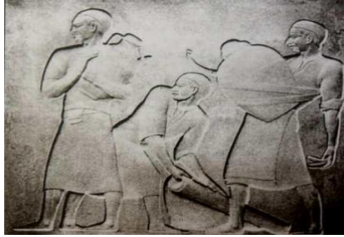
لوحة جدارية بأسلوب النحت الغائر حجر صناعي للفنان محمود مختار