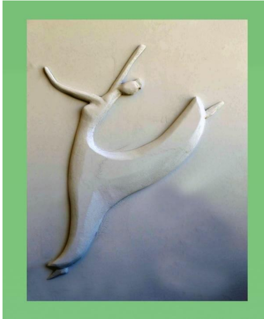
شكل رقم (٥) من اعمال الباحث