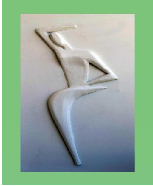
شكل رقم (٧) من اعمال الباحث