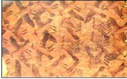
شكل رقم (٣) رسم زخرفي بالحبر الملون يمثل طيور في شبكة صيد حوالي سنة (١٣٠٥-١٠٨٠ ق.م).