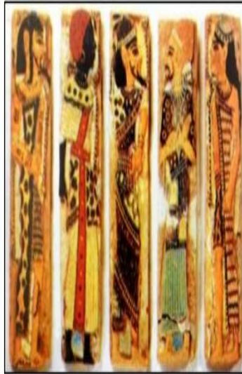
شكل رقم (٧)

مجموعة من اللوحات بجدران معبد رمسيس الثالث الجنازسي