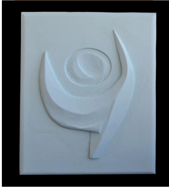
شكل رقم (٩)

الخامات: مادة طلاء. mdf. خامه العمل: خشب