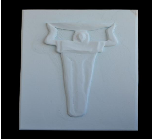
شكل رقم (١٠)