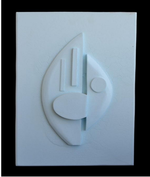
شكل رقم (٨)