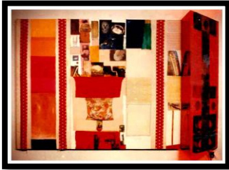
شكل (٦) روشنبرج، سيرك الأعمدة، ٢٤٣×٨×٦٦ سم ١٩٧٩ خامات مختلفه من بقايا الأقمشة وخامات أخرى ( الديب، سحر، ١٩٩٨: ص ٦٤ )

وهو يعد بمثابة تطوير (الريدي ميد) وهو نتاج للأيدي الخفية التي استغلت واقع الحضارة الصناعية، وقد استعان هذا المذهب بمجالين أحدهما يستخدم الأشياء الصناعية في العمل الفني والثاني يلجأ إلى أسلوب الصورة الدعائية التلفزيونية أو السينمائية وغيرها. وقد عبر الفنان روشنبرج Rouchinberg من خلال مجموعة الخامات المختلفة عن مدى " التناقض الذي نلمسه في الحياة اليومية وكأنها سيرك كبير ولذلك فقد تخير مجموعة من قصاصات الأقمشة والمجلات، ويبدو من توزيع الفنان لتلك العناصر أنها بدت في صورة مجلة حائط، وقد أضاف في ذلك العمل بعض المؤثرات البصرية عن طريق استخدام المرايا وبعض الأضواء الحمراء أيسر اللوحة، ولم يريد الفنان أن يجعل مركزاً لهذه اللوحة بل أراد أن يقسم اللوحة إلى مجموعة أجزاء عن طريق مجموعة من الشرائط المصنوعة من الأقمشة التي عبر بها عن الأعمدة الإغريقية وذلك بغرض توزيع المشاهد في جوانب واتجاهات مختلفه من اللوحة وأهم ما يميز هذا العمل هو استخدام الفنان لمجموعة متنوعة من قصاصات الأقمشة برسوم النقط والكارورة المقلم، وقد وزعت هذه الأجزاء في صورة محسوبة في أجزاء مختلفه من العمل " . ( الديب، سحر، ١٩٩٨: ص ٦٤ ) كما في شكل (٦).