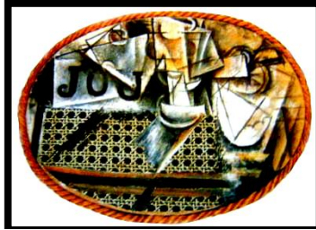
شكل (٢) طبيعة صامته خيزران - متحف بيكاسو باريس - زيت- كولاج ، ١٩١٢ ( عبد العاطي، مروى، ٢٠٠٨، ص٢٦)

وتبدو لوحة " طبيعة صامته مع كرسي خوص للفنان بيكاسو والتي صورت في ربيع ١٩١٢ من أروع الأمثلة على ما سبق قوله حيث استخدم الفنان نوع من النسيج الدقيق مغطى بأرضية فاتحة اللون وذلك لإستطاعة التحكم في درجات اللون بعد ذلك، وسطح العمل غطى بطبقات لونية من الأوكر ثم تم الرسم عليها بفرشاة ولمسات عريضة، والصورة محاطة بإطار من الحبال كبرواز، حيث يعتبر جزءاً لا يتجزأ من العمل الداخلي من ناحية الشكل والتصميم"، ( هبة، فاروق، ٢٠٠٦: ص٤٣)، شكل (٢).