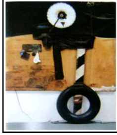
شكل (٥) روشنبرج، خامات متعددة ( صالح، صفاء، ١٩٩٤: ص ٣٥ )

التكوين والتي تم إضافتها على سطح القماش، حيث استخدم أسلوب الطباعة بالشاشة الحريرية في أجزاء من التكوين " ( صالح، صفاء، ١٩٩٤: ص ٣٥ ). كما في شكل (٥).