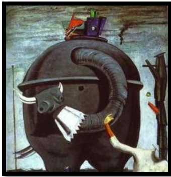
شكل (٤) ماكس أرنست The Elephant Celebes (هبة، فاروق، ٢٠٠٦: ص ٣٤)