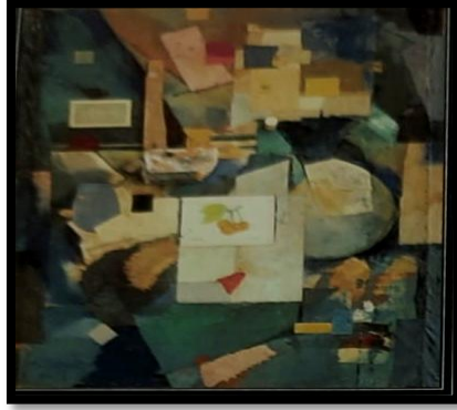
شكل (٣) شويترز "صورة شيري"، ١٩٢١م، أضاف قصاصات من أوراق ملونة، قماش ، شرائح خشبية ومعدنية، فلين ، ألوان جواش، زيت، حبر على ورق مقوى

ومن الفنانين المجددين الفنان "ماكس أرنست" ترتبط أعماله بمدرسة الداذا والسريالية فإستخدامه عناصر متنافرة في لوحاته، وإدخال اللغة إلى اللوحة لتشكيل بعداً جديداً فيها حيث أضاف عناوين ألصقتها بعفوية في أعلى وأسفل اللوحة ، ومن اعماله (البوسطجي شيقال ) ١٩٢٩م عبارة عن مفردات موزعة داخل مساحة العمل مثل البطاقة البريدية ذات الفتحة الجانبية ، ومجموعة من الطابع البريدية القديمة وطائر كرمز لساعي البريد وبورتريه لوجه فتاة .شكل (٣)