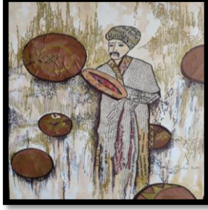
شكل رقم (١١) المقاس : ٥٠×٣٥ سم.

سطع اللوحة لتأكيد العمق في اللوحة والإحساس بالحركة والإيقاع البصري بين الخطوط المختلفة للعمل مما أكد فكر الباحث ومضمون العمل.