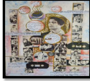
شكل رقم (١٠) المقاس : ٥٠×٣٥ سم.

الخامات المستخدمة : توال ، ألوان أكريليك أساليب وتقنيات المستخدمة العمل الفني أعطي قيمة جمالية وتعبيرية للعناصر المستخدمة بأسلوب مختلف وأضاف الباحث الالوان علي سطع اللوحة لتأكيد العمق في اللوحة والإحساس بالحركة والإيقاع البصري بين ، اقلام تحبير ، المطبوعات الجاهزة .