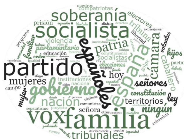
Gráfico 2. Nube de palabras clave más utilizadas por Abascal en el corpus

Si reflexionamos sobre el uso del léxico, es patente destacar, siguiendo a Fuentes Rodríguez (2019) 21 , que "tiene una alta capacidad persuasiva. Políticos y comunicadores cuidan la selección léxica, conscientes de su funcionalidad como mecanismo argumentativo." En su discurso, Abascal utilizó un vocabulario intencionadamente emotivo y evocador, apelando a conceptos como "patria", "familia" y "tradiciones". Su objetivo es conectar con los valores y sentimientos profundamente arraigados en la sociedad española, creando un vínculo emocional con su audiencia. La figura siguiente muestra la predominancia de términos que respaldan el enfoque de Abascal y su partido Vox, y que evidencian sus señas de identidad populista.