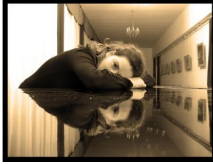
شكل ( ٢ )

٢- تكوين قائم على قانون الثلث Law of Thirds : وهو الصيغة التي قدمها "إقليدس" عن نموذج الجمال المثالي وهو أن النسبة بين الجزء الأكبر والأصغر يساوي النسبة بين الجزء الأكبر والكل، وهو ما يطلق عليه النسبة الذهبية أو القطاع الذهبي، ويعتبر هذا التكوين هو الأكثر قدرة على جذب الإنتباه وإثارة عين المتلقي ، ويوضح ذلك شكل رقم ( ٣ ) .