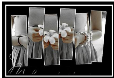
شكل (١) يوضح تقطيع وتفكيك الصورة الفوتوغرافية

٣- تمزيق جزء من الصورة الفوتوغرافية ليصبح جزء من حدودها الخارجية غير منتظمة عفوية يصيغها الفنان بنفسه مباشرة فوق سطح القالب الطباعي تتضاد مع الآلية المنتظمة في إستخدام بعض التأثيرات.