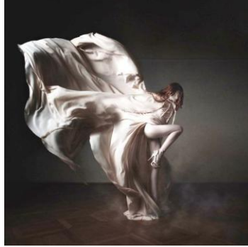
شكل (٣) (الفتي، محمد، ٢٠١٥ . ص٦٥)

٢- تكوين قائم على قانون الثلث Law of Thirds : وهو الصيغة التي قدمها "إقليدس" عن نموذج الجمال المثالي وهو أن النسبة بين الجزء الأكبر والأصغر يساوي النسبة بين الجزء الأكبر والكل، وهو ما يطلق عليه النسبة الذهبية أو القطاع الذهبي، ويعتبر هذا التكوين هو الأكثر قدرة على جذب الإنتباه وإثارة عين المتلقي ، ويوضح ذلك شكل رقم ( ٣ ) .