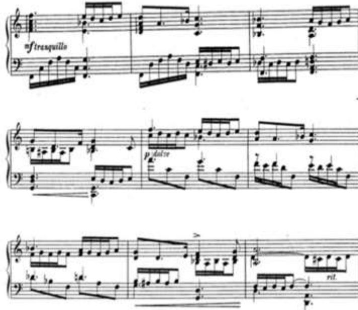
شكل رقم (٢) يوضح الجزء الثاني.

➤ الجزء الثاني (B) من م (١٧): م (٢٧) في سلم فا الكبير والصياغة اللحنيه عبرت عن التالفات الرباعيه والنغمات السلميه الصاعده الهابطه في اليد اليمنى والنغمات الاربيجيه والتالفات الثلاثيه والرباعيه في اليد اليسرى والشكل التالي يوضح ذلك: