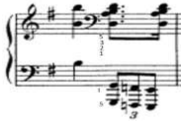
شكل (١٥) يوضح صعوبة أداء المقابلة الثنائية في اليد اليمنى مع الثلاثية في اليد اليسرى