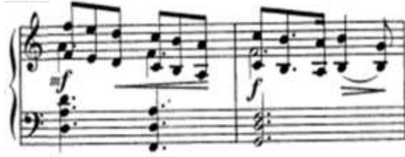
شكل رقم (5) اداء اليد اليمنى لأوكتاف مع تألفات ثلاثية في اليد اليسرى