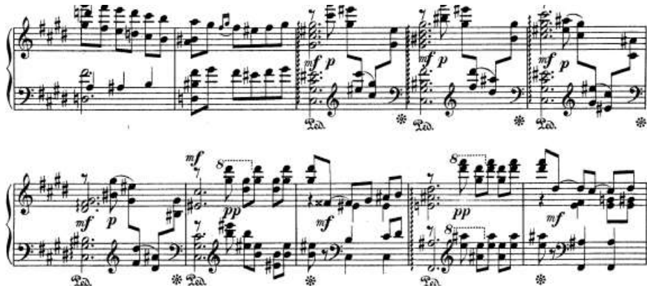
شكل رقم (١٨) يوضح الجملة الأولى للجزء الثاني

من م (٢٨): م (٣٧) عباره عن جملة موسيقية مطوله صارت فيها الصياغه اللحنية على نفس منوال الفكر السابقه مع ظهور الاكتافات في اليد اليمنى والشكل التالي يوضح ذلك: