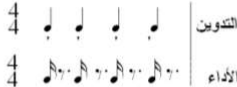
شكل رقم (٢٤) يوضح تدوين الإنفصال الجاف والآداء.

ويعنى الإنفصال الجاف أو الصلب ويشار إليه بوضع علامة صغيرة تشبة رأس المثلث فوق أو أسفل النغمات ويتسم اسلوب الآداء بإنفصال النغمات بعضها عن بعض بسكتة تعادل ثلاثة أرباع قيمتها الزمنية تقريباً وتأخذ النغمات المعزوفة ربع القيمة الزمنية المخصصة لها والشكل التالي يوضح التدوين والآداء: