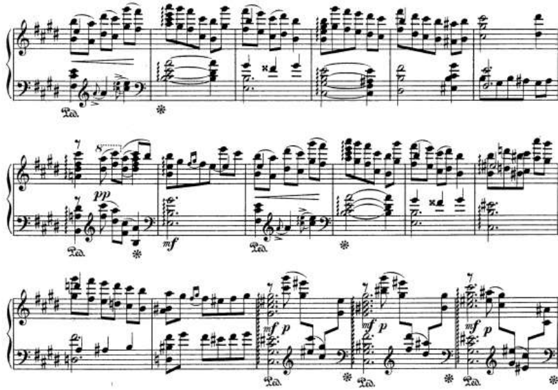
شكل رقم (١٧) يوضح الفكره الثانيه.

من م (١١): م (١٩) عبرت الصياغه اللحنيه عن تالفات رباقيه واكتافات صاعده هابطه في اليد اليمنى اما اليد اليسرى فهي عباره عن نغمات مزدوجه وتالفات ثلاثيه بحليه الاريجيو والشكل التالي يوضح ذلك: