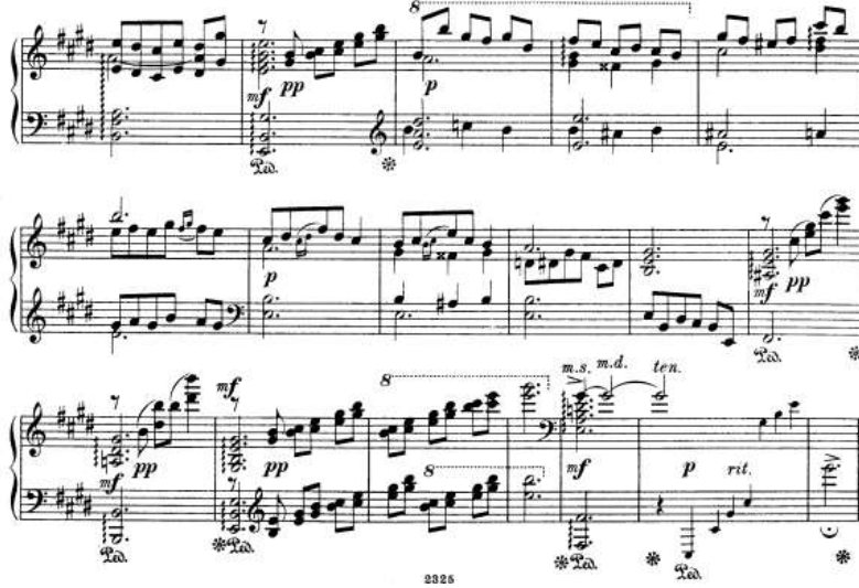
شكل رقم (٢٠) يوضح الكودا.

وفيما يلي وصفاً للصيغة البنائية للبريليوود الثالث للبيانو المنفرد مصنف ٨ عند نيكولاى امانى: