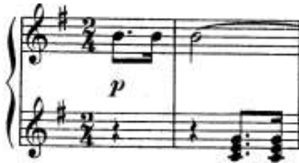
شكل رقم (١٢) يوضح تألفات هارمونية ثلاثية لليد اليسرى

الصعوبات التقنية التي جاءت في المقطوعة الثانية، وإقتراحات تذليلها: ➤ الصعوبة الاولى: تألفات هارمونية ثلاثية لليد اليسرى، والشكل التالي يوضح ذلك: