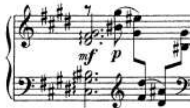
شكل رقم (٢٦) يوضح حلية الأربيجيو في اليد اليسري.