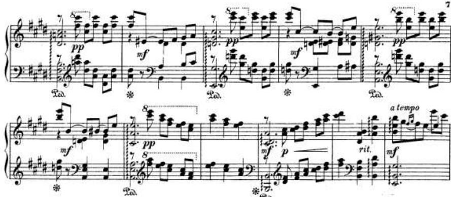
شكل رقم (١٩) يوضح الجملة الثانية للجزء الثاني.

من م (٢٨): م (٣٧) عباره عن جملة موسيقية مطوله صارت فيها الصياغه اللحنية على نفس منوال الفكر السابقه مع ظهور الاكتافات في اليد اليمنى والشكل التالي يوضح ذلك: