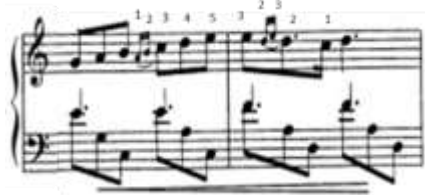
شكل رقم (4) يوضح حلية الاتشيكاتورا الثانية.

➤ الصعوبة الثانية: صعوبه اداء حلية الاتشيكاتورا الثنائيه وظهرت في م (٤،٣) في اليد اليمنى، والشكل التالي يوضح ذلك: