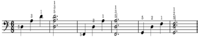
شكل رقم (7) يوضح تمرين رقم (2) المقترح من قبل الباحث