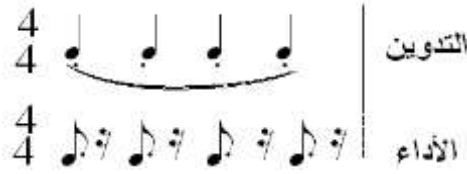
شكل رقم (٢٣) يوضح تدوين الإنفصال العذب والآداء.

ويعرف بإسم الإنفصال العذب ويشار إليه بوضع نقط فوق أو أسفل النغمات داخل قوس لحنى فوق النغمات ويتسم اسلوب الآداء بخفة وعذوبة في إصدار النغمات يفصل بين نغمات سكتات قصيرة تعادل ربع قيمتها الزمنية بينما تأخذ النغمات المعزوفة ثلاثة أرباع قيمتها الزمنية والشكل التالي يوضح التدوين والآداء: