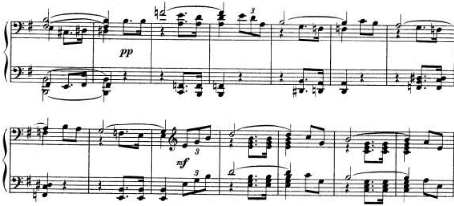
شكل رقم (٩) يوضح الجملة الثانية.

من أناكروز م (٩): م (١٦) وهي عبارة عن جملة موسيقية منتظمة تؤديها اليدان في مفتاح (فا)، والصياغة اللحنية عبرت عن تعدد الاسطر اللحنية ونغمات مزدوجة في اليد اليمنى اما اليد اليسرى عبارة عن نغمات على بعد رابعه وخمسه تامه وتآلفات ثلاثيه والشكل التالي يوضح ذلك: