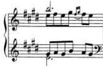
شكل (٢٨) صياغة لحنية بوليفونية متعددة الأسطر اللحنية.