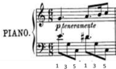
شكل رقم (3) يوضح صعوبة اداء نغمات متكررة.