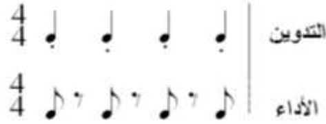
شكل رقم (٢٢) يوضح تدوين الاستكاثو العادى والآداء.

قيمتها الزمنية لكل نغمة بينما تأخذ النغمات المعزوفة النصف الآخر من القيمة الزمنية للشكل الإيقاعي الاصلى المدون والشكل التالي يوضح التدوين والآداء: