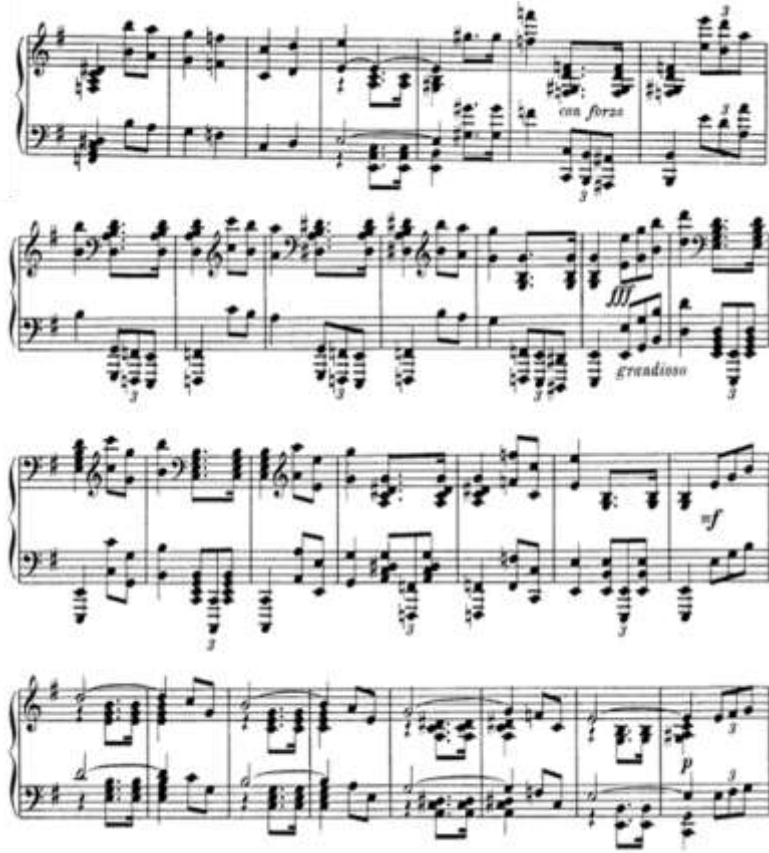
شكل رقم (١١) يوضح الجزء الثاني

➤ الجزء الثاني (B) من م (٢٥): م (٤٨) في سلم مى الصغير والصياغة اللحنيه عبرت عن ظهور الاوكتافات والتالفات الثلاثيه والرابعيه بكثره في اليد اليمنى اما اليد اليسرى فظهرت فيها تالفات الرابعيه وابقاع الثلاثيه مع الاوكتافات الهابطه والشكل التالي يوضح ذلك: