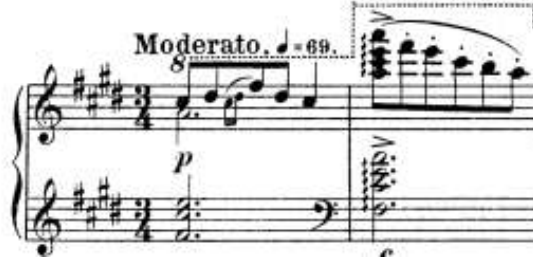
شكل رقم (٢١) يوضح صياغة لحنية توضح أسلوب العزف المنقطع.

وظهر ذلك في معظم اجزاء المدونه والشكل التالي يوضح ذلك.