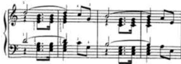
شكل (١٤) يوضح صعوبة أداء خطين لحنيين متشابهين

➤ الصعوبة الثانية: صعوبه اداء خطين لحنيين متشابهين ايقاعيا و نغميا، وظهر في المدونة الموسيقية في م (١٨، ١٩)، والشكل الآتي يوضح ذلك: