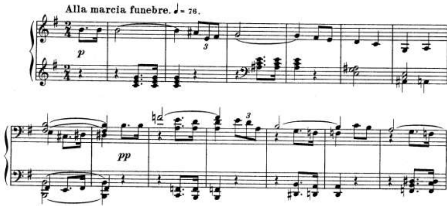
شكل رقم (٨) يوضح الجملة الاولى.

من أناكروز م (١): م (٨) والصياغة اللحنيه عبرت فيها عن نغمة منفردة ممتدة زمنيا مع نغمات منفردة هابطة في اليد اليمنى وتالقات ثلاثيه ونغمات مزدوجة في اليد اليسرى في سلم صول الكبير والشكل التالي يوضح ذلك: