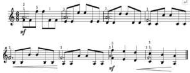
شكل رقم (6) يوضح تمرين رقم (1) مقترح من قبل الباحث