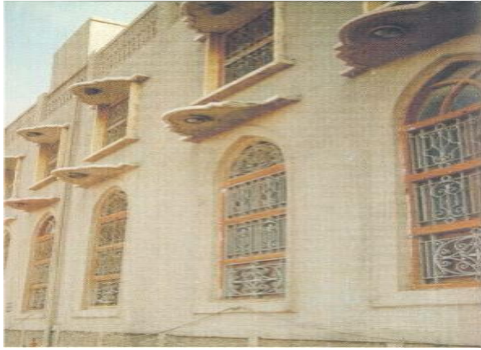
شكل (١) منزل كويتي قديم

ان من ابرز عناصر العمارة الكويتية التي يمكن معرفتها من خلال القاء نظرة سريعة على المباني القديمة التي مازالت قائمة حالياً وتتمثل في الحوش (الفناء الداخلي) الذي يتيح للغرف التهوية الكاملة والليوان وهو الممر الذي يفصل بين الغرف والحوش والدهليز والسطح والشبابيك والكشتمان (السندرة) والابواب وتكون مصنوعة من الخشب بأنواعه الاحمر والساج، اضافة الى المرزاق والجنديل والباكير الذي يسمى في الدول العربية (ملقف الهواء المعماري الكويتي (المطوع ، صالح ، ٢٠٠١، العدد 8108)