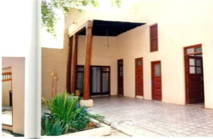
شكل (٢) ليوان وحوش لأحد البيوت

الأبنية العامة كالمستشفى الأمريكي الذي تم تشييده عام ١٩١٢ كذلك كان هناك عدد من المباني ذات الطابع العام كما في شكل (١) ومنها سور الكويت وبواباته، وكذلك الميناء القديم والنقع مراسي السفن (جمال، محمد عبد الهادي، ٢٠٠٣م، ١٥١)