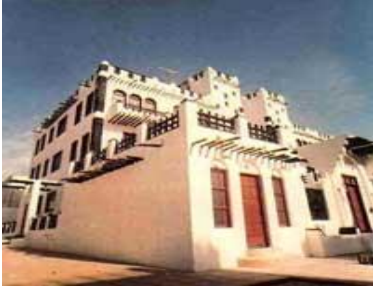
شكل رقم (٥)

وقد وجدت هذه الدعوة استجابة عالمية، وتكونت حولها مدرسة في العمارة تدعو إلى العمارة البيئية أو العمارة المحلية، كنمط بديل لعمارة الكتل الخرسانية التي ضخمت أحاسيس الغربة عند الإنسان المعاصر وأفقدته العلاقة الحميمة التي تنشأ بينه وبين المكان والأشياء، وأيضا كنمط معماري تحل به مشكلة إشباع احتياجات السكان لمسكن ملائم يحفظ لهم خصوصيتهم وإنسانيتهم.