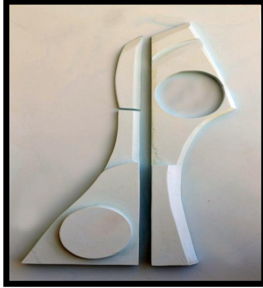
شكل رقم ( ١ )