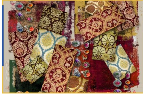
شكل (١) يوضح بعض الأقمشة

المزخرفة بالخياطة الذهبية في العصر العثماني