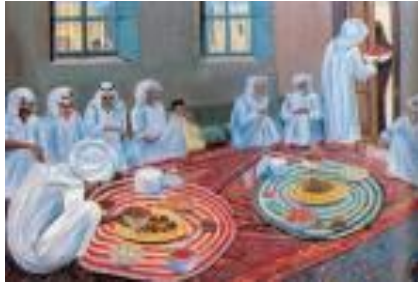
شكل رقم (٥) الفنان التشكيلي الكويتي ايوب حسين الايوب - عزيمة المعرض الاول للبيئة الكويتية ١٩٦٧م

وارتبطت أعمال الفنان ( إبراهيم إسماعيل ) بنمط الحياة في الكويت قديما وبالحنين الدائم إليها مما دفعه بشكل تلقائي منذ انطلاقة مسيرته الفنية في بداية السبعينيات من القرن الماضي. وخلال تلك المرحلة مزج الفنان بين تأثيره العميق بالبيئة الكويتية وإحياء مفرداتها واقتناصها على سطح اللوحة وبين تطوره الدائم ومحاولة اكتشاف أساليب جديدة وابتكار أسلوب تعبيرى متميز خاص به، ونجح في تحقيق تلك التوليفة المتسمة بالبساطة وبناء تكوين لوحته من مساحات وتقسيمات ملونة تنتشر على سطح القماش وتترابط فيما بينها تحت خطوط هندسية متقاطعة.