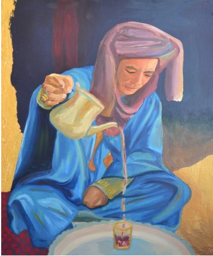
العمل رقم (٢) شكل رقم (١٢) شخص يحمل براد شاي خامه العمل : الوان زيت ، شاسية خشب ، طلاء ابيض ، قماش ابيض مساحه العمل : ٦٠*٧٠

المتناغم بين الشكل و الخلفية داخل عناصر العمل بماوقد استلهم العمل من العادات والتقاليد الشعبية التي استخدمها الفنانين التصويريين يحقق بذلك فرض البحث.