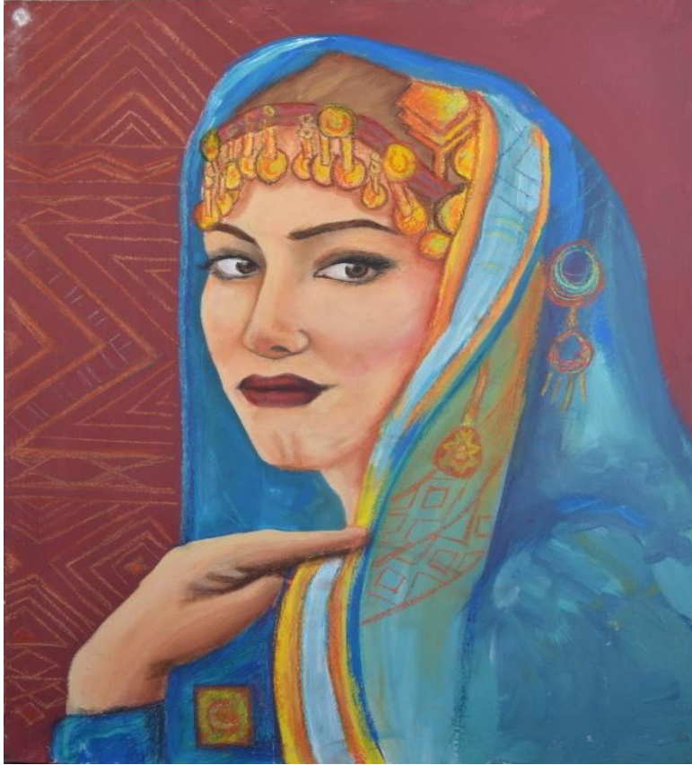
العمل رقم (١) شكل رقم (١١) فتاة بالزي التقليدي

خامه العمل : الوان زيت ، شاسية خشب ، طلاء ابيض ، قماش ابيض