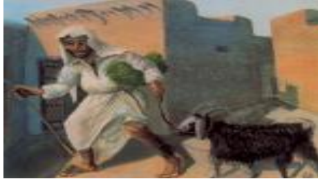
شكل رقم (٤) الفنان التشكيلي الكويتي ايوب حسين الايوب - المودى .. لوحة مشاركة في معرض الربيع الخامس للفنون الجميلة ١٩٦٣