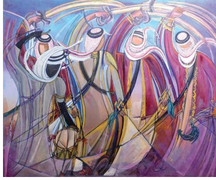
شكل رقم ( ١٠ ) الفنان التشكيلي الكويتي إبراهيم إسماعيل