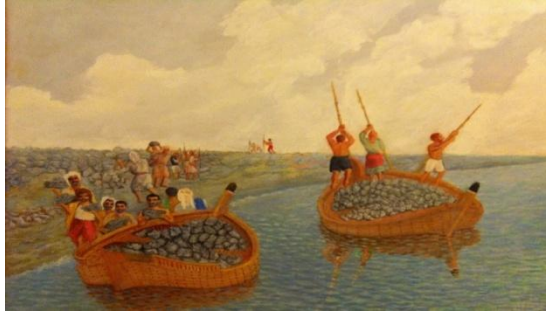
شكل (٢) الفنان التشكيلي الكويتي حسين مسيب - مقال الصخور الواقعية الاجتماعية في لوحات الفنان الكويتي حسين مسيب شبكة الدانة الاعلامية . ٢٠٢٤م

كما اهتم الفنان ايوب حسين الايوب بتسجيل التراث الكويتي في لوحاته التي تنتمي الى الواقعية الاجتماعية ولوحاته تمثل البيئة الكويتية القديمة ويعتبر أول من عمل بمتحف الكويت عام ١٩٥٦م وأشرف على تأسيسه، حيث صمم وبنى بيده نماذج متعددة للبيت الكويتي القديم، وهو من الفنانين التسجيليين الذي وثق البيئة الكويتية وعادات الناس ومهنهم وألعاب الأطفال إضافة إلى العمارة أو البيوت القديمة، بل لعله الفنان التشكيلي الذي وثق وسجل قرية حولي وشكل البيوت القديمة " الكبر " وما تتميز به حولي من آبار ماء وزراعة وجمالها في الربيع حيث يقبل الناس على " الكشنة " في حولي أيام الربيع لخضرتها وجمالها. كما في اشكال (٣-٤-٥)