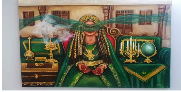
شكل رقم ( ٤ ) ابتسام العصفور الجلوه من مراسم الاعراس القديمة ٢٠٢٣م تشكيلية كويتية تحوّل العادات والتقاليد إلى لوحات فنية https://www.ajnet.me/arts/٢٠٢٣