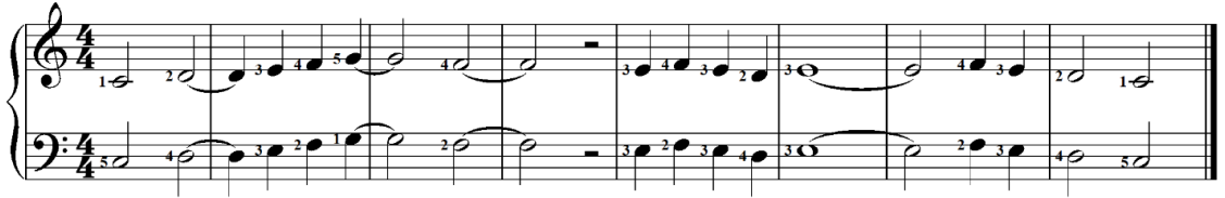
تمرين رقم (21)

- تمرين مهاري مقترح للتمرين التاسع بكتاب ميكرو كوزموس لبيلا بارتوك: