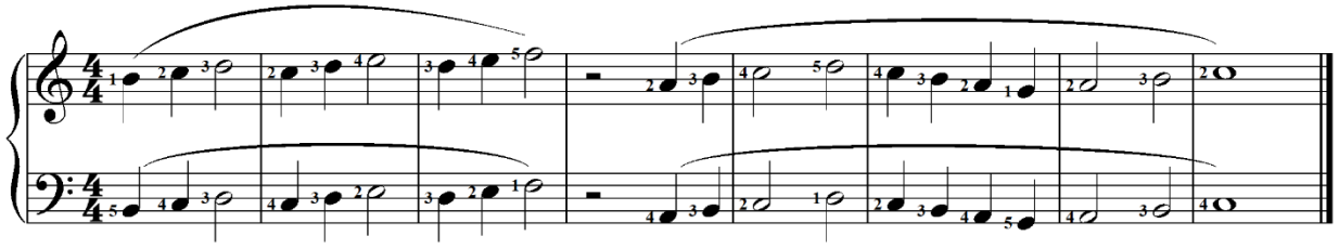
تمرين رقم (18)