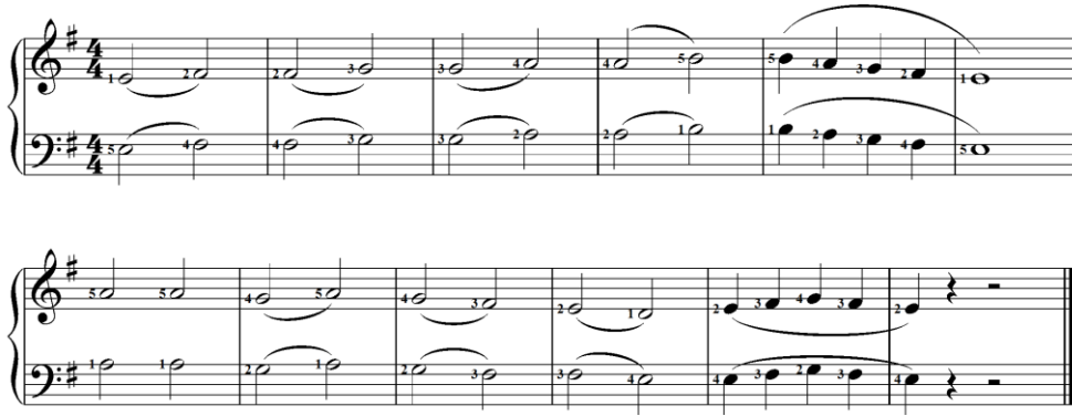
تمرين رقم (20)