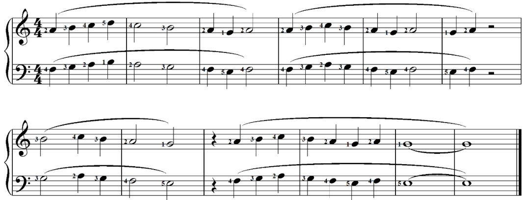
تمرين رقم (22)

- تمرين مهاري مقترح للتمرين الحادي عشر بكتاب ميكرو كوزموس لبيلا بارتوك: