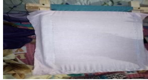
صورة رقم (٣)

٢- النول : هو عبارة عن اطار خشبى مستطيل الشكل ويمكن إطالته وتقصيره حسب طول القماش