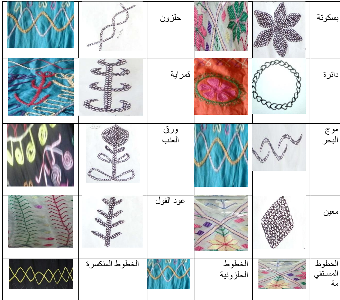
شكل رقم (١) الوحدات الزخرفية الخاصة بفن تطريز المنسج (الباحثة من خلال الدراسة الميدانية)

خاصة لبيئة معينة أو فئة معينة من الناس، ومنها: رموز عامة وهى رموز يتفهمها العامة بوضوح من أفراد الثقافة الواحدة ورموز خاصة: وهى رموز لا يعرف مدلولها إلا رجال الدين ثم ينقلوها الى العامة عبر الأشكال الفنية. (حنان حسنى يشار، نجلاء محمد طعيمة، رودانيا محمد رشاد، جهاد إسماعيل على ، ٢٠٢٢م ، ص٣١)