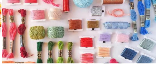
صورة رقم (١) خيوط الكتون بيرلية التى تستخدم فى تطريز المنسج صورة رقم (٢) خيوط الكتون بيرلية التى تستخدم فى تطريز المنسج