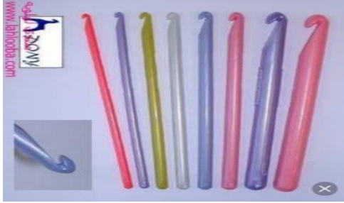
صورة رقم (٦) إبرة الكروشيه البلاستيكية

خيوط (الكتون بيرليه) من أسفل وتطريز الوحدات الزخرفية