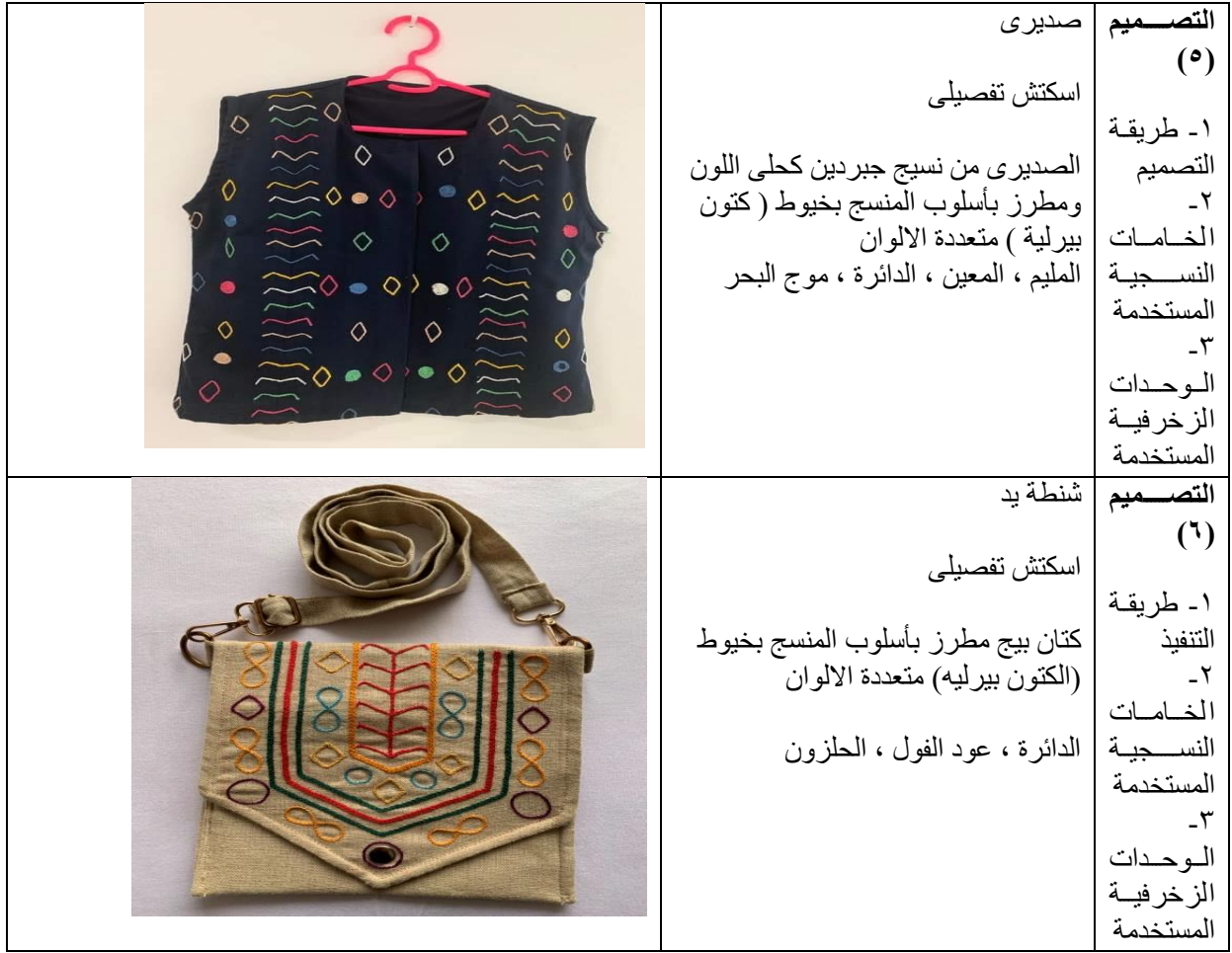
شكل رقم (٢) يوضح صور التصميمات المنفذة بتطريز فن (المنسج)

لها مع إمكانية تعديل صياغة أو حذف أو إضافة عبارات جديدة ليصبح المقياس أكثر قدرة على تحقيق الغرض الذي وضع من أجله. وفي ضوء اتفاق المحكمين استبقت الباحثة على البنود التي حصلت على نسبة اتفاق (٨٠% فأكثر) من عدد المحكمين ، وتم إعادة صياغة بعض العبارات وأدخل بعض التعديلات عليها بناءً على ملاحظات المحكمين فقد أصبح الاستبيان في صورته النهائية بعد إجراء تعديلات السادة المحكمين مكون من (١٢) عبارة موزعه على ثلاث محاور (المحور الاول مكون من ٥ عبارات)، (المحور الثاني ويتكون من ٤ عبارات)، (المحور الثالث ويتكون من ٣ عبارات).