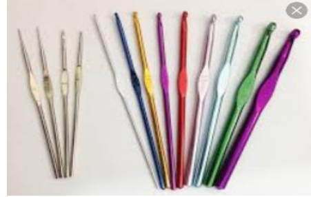
صورة رقم (٥) إبرة الكروشيه المعدنية

٣- إبرة الكروشيهية : تستخدم إبرة الكروشيه التقليدية ذات المقاس متوسط لتساعد فى ثقب النسيج والتقاط