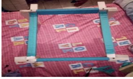
صورة رقم (٤)

المشدود عليه بواسطة أربطة معدنية مثبتة فى اركانه.