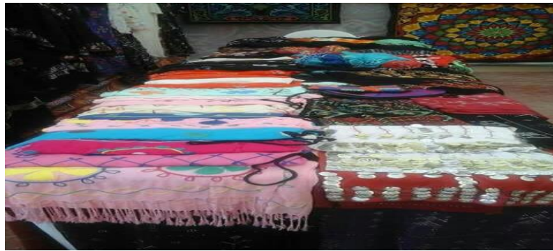
صورة رقم (٨) توضح مشغولات مختلفة مطرزة بشغل المنسج