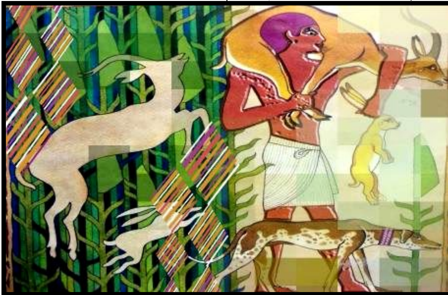
شكل (٢٣) تصميم رقم (٥)

هذا التصميم مستوحى من شكل رقم (١٠)، المتمثل في عملية الصيد لرمسيس الثاني وسط الأحرار، وقد قسم التصميم لنصفين رأسيين بالتساوي مما عمل على اتزان التصميم حول