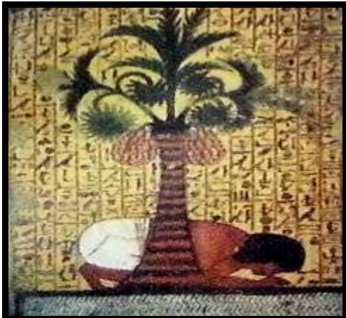
شكل (١٤): رسم جداري ملون على الجبس، مقبرة "بشد" الأسرة ١٩

واستخدمها المصريون في صناعة أسقف المنازل، ساريات السفن، ومواسير المياه، أما السعف فاستخدم في صناعة السلال، والحصير ومن أليافه عملت الحبال، وفرش الألوان،