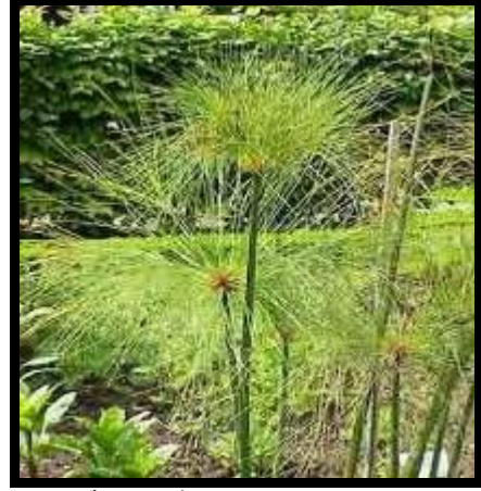
شكل (٧): نبات البردي في الطبيعة

أفريقي لكنه ينمو أيضا في وسط آسيا وجنوب أوروبا، وهو نبات أصيل في مصر وقد اشتهر في مصر القديمة مع بداية عصر الأسرات، فكان رمزا لجنوب البلاد، كما اعتقدوا أنه نبات مقدس لارتباطه بالعلم والمعرفة (تحت) حيث رسموه في هيئة إنسان له رأس طائر ويحمل في يده ورقة البردي وقلمًا للكتابة.