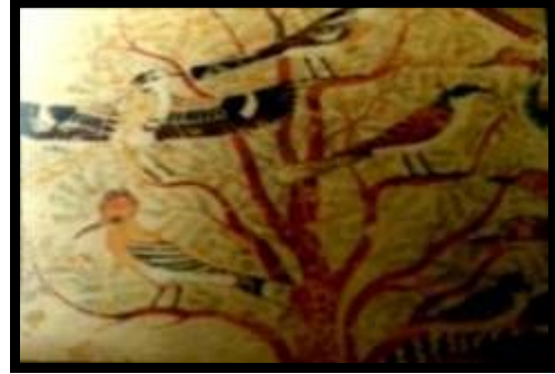
شكل (٤): رسم جداري ملون على الجبس، مقبرة "خنوم حنب" الأسرة ١٢