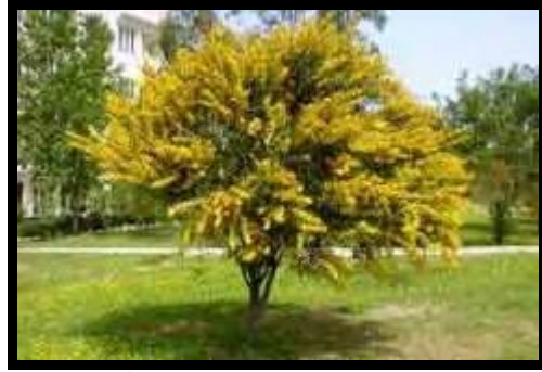
شكل (٣): نبات السنط في الطبيعة