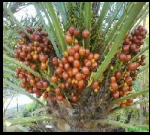
شكل (١٣): نبات الدوم في الطبيعة

من أشجار النخيل التي تنمو برياً أو تزرع في المناطق الجافة، ويصل ارتفاعها إلى ٢٠ متر، جذع النخلة ثنائي التفرع، بمعنى أن الساق تنقسم أثناء النمو اثنين، وكل واحد من الاثنين ينقسم أثناء النمو إلى اثنين، وكل واحد من الاثنين ينقسم بدوره لأثنين وهكذا.. وأوراقها مروحية وثمارها كبيرة في حجم الكوي، والغلاف الخارجي للثمرة لبي صلب ذو لون بني أملس وتحتوي الثمرة على بذرة واحدة صلبة جدا تشبه البيضة في حجمها شكل (١٣)، موطنها الأصلي هو قارة أفريقيا، وكانت تزرع في مصر القديمة منذ عصر ما قبل الأسرات، خشبها صلب مقاوم للماء.