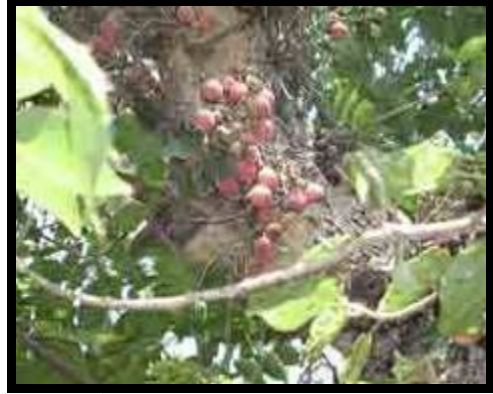
شكل (١١): نبات الجميز في الطبيعة

شجرة ضخمة دائمة الخضرة، تتحمل الجفاف معمرة يصل ارتفاعها إلى حوالي ٨ - ١٥ متراً، تحمل أوراقاً متطاولة رمحية الشكل ملفوفة ما إلى الداخل شكل (١١)، وهي من الأشجار الأصلية في وادي النيل، موطنها الأصلي الشرق الأوسط وشرق إفريقيا وتشتهر بهذا النبات المملكة العربية السعودية، وهي من الأشجار الظليلة كما يطلق عليها اسم شجر الرقاق وفي بعض المناطق شجر الثالق أو الأبراء، تعطي الشجرة ثماراً كثيرة تشبه في شكلها ثمار التين إلا أنها صغيرة خضراء قبل النضج ويتحول لونها إلى اللون الوردي بعد النضج، وهي من الثمار المأكولة.