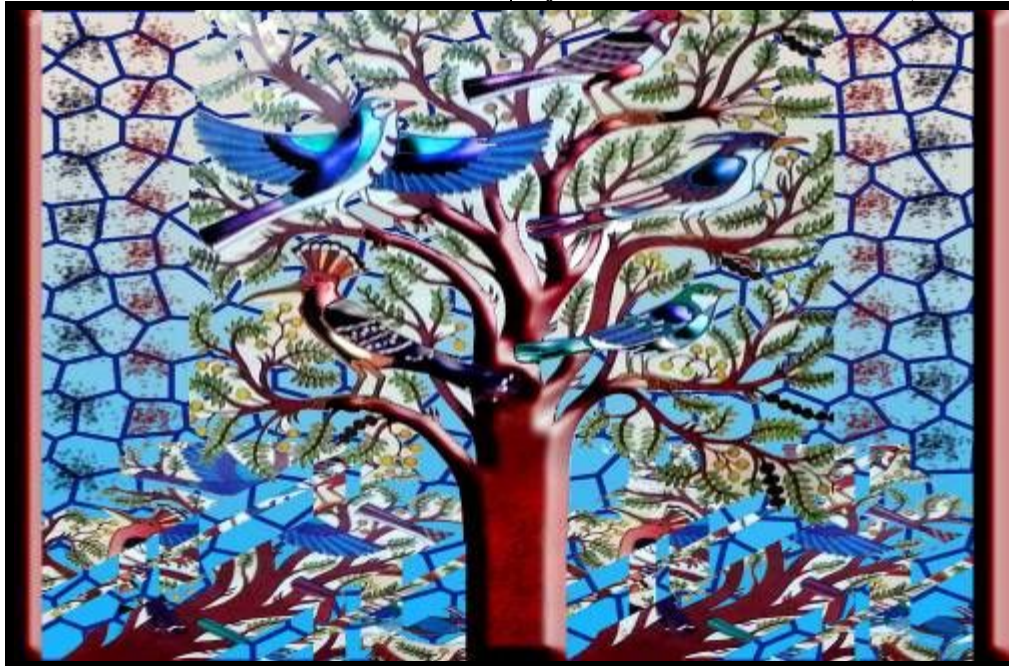
شكل (١٧): تصميم رقم (٢)

٢-١-٦ تصميم رقم (٢) من نبات السنط: هذا التصميم مستوحى من شكل رقم (٤)، حيث شجرة السنط والطيور المغردة تقف على أغصانها، وقد احتل العنصر النباتي أكثر من نصف مساحة التصميم وذلك للتأكيد على أهمية العنصر النباتي