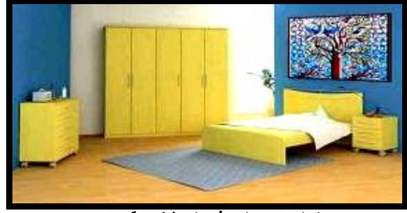
شكل (١٨): النموذج التوظيفي رقم (٢)

والعنصر البشري المتمثل في الفتيات في مشهد وصفي لحاله معينة يتضح فيها استخدام نبات الأفحوان كمستحضر تجميلي لتحسين البشرة، وباستخدامه تصير البشرة أجمل وانقي لأنه يساعد في القضاء على التجاعيد وآثار التقدم في العمر، وقد استخدمت أزهار الأفحوان أيضا في تجميل زى الفتيات، واستخدمت درجات الألوان الأحمر، الأخضر، الأزرق والبنّي بدرجاتهم في تدرج واضح بأرضية التصميم باستخدام إمكانات الحاسب الآلي، وقد تحقق في هذا التصميم بعض الخصائص التشكيلية من الفن المصري القديم مثل: التكرار، الشفافية، التسطیح، بجانب بعض الأسس الجمالية كالتنوع والتدرج. وتلى ذلك نموذج توظيفي مقترح لاستخدام التصميم بحجرة الطفل