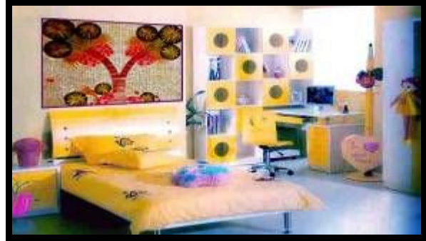
شكل (٢٨) النموذج التوظيفي رقم (٧)

http://www.kassioun.org/index.php?mode=archivebody&id=201759