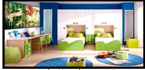
شكل (٢٤) النموذج التوظيفي رقم (٥)

حيث مالت فكرته إلى اعتبار أن شجرة الجميز شجرة تطل عبر نافذة، وتم استخدام الخطوط الهندسية الحادة في عمل تقسيمات هندسية بالتصميم، بجانب أوراق الشجر التي تتسم بالطابع العضوي المرن مما أحدث تباين بين عناصر التصميم مما اثنى من قيمته، واستخدم اللون الأخضر، الأحمر، الأسود بدرجاتهم مع الاستفادة من إمكانات الحاسب الآلي في إعطاء بعض التجسيم والبروز لبعض أجزاء التصميم، وقد تحقق في هذا التصميم بعض الخصائص التشكيلية من الفن المصري القديم مثل: التكرار، التسطیح، التماثل. بجانب بعض الأسس الجمالية للتصميم مثل التنوع، التدرج، الإيقاع، التنوع، التدرج... وتلى ذلك نموذج توظيفي مقترح لاستخدام التصميم بحجرة الطفل.