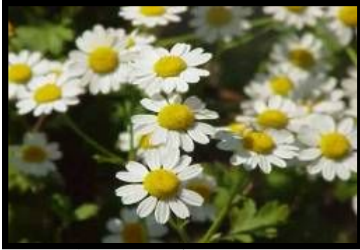
شكل (٥): نبات الأفيون في الطبيعة

نبات عشبي حولي شتوي يتميز بالنمو السريع ويصل ارتفاعه بعد الإزهار إلي (٥٠ - ١٢٠ سم)، أوراقه لونها اخضر داكن ناعمة الملمس، موطنه الأصلي جزر الكناري، جنوب ووسط أوروبا، وشمال أفريقيا وانتشرت زراعته في معظم بقاع العالم خاصة المناطق المعتدلة الدافئة، له ساق مضلعة عارية وقليلة الفروع، والأوراق مجنحة ومسننة وتفوح منها رائحة تشبه رائحة الكافور عند هرسها، وأما الأزهار فمستديرة في وسطها رأس نصف كروي أصفر اللون يتكون من زيت طيار، ومواد مرة شكل (٥).