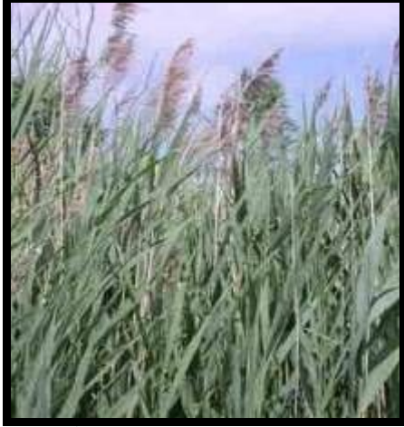
شكل (٩): نبات البوص في الطبيعة

هو نبات نجلي ينمو بربا بكثرة علي أطراف القنوات ويصل ارتفاعه إلي مترين، له ساق طويلة تحمل أزهارا مجتمعة في نوره شكل (٩)، ينمو في المناطق المعتدلة والدافئة ( Taylor 2010). وهو من النباتات الأصيلية في وادي النيل.