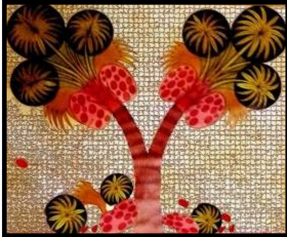
شكل (٢٧) تصميم رقم (٧)

من إمكانات الحاسب الآلي في الشبكية الهندسية بخلفية التصميم، مع إعطاء بعض التأثيرات والبروز بها، وقد تحقق في هذا التصميم بعض الخصائص التشكيلية من الفن المصري القديم مثل: التكرار، المبالغة والتحريف، الشفافية، التسطیح، التماثل. بجانب بعض الأسس الجمالية للتصميم مثل التنوع، التدرج، الإيقاع، التنوع، التدرج... وتلى ذلك نموذج توظيفي مقترح لاستخدام التصميم بحجرة الطفل.