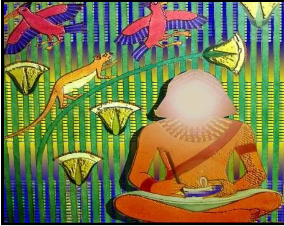
شكل (٢١) تصميم رقم (٤)

محوره الرأسي، واستخدم العنصر البشري، العنصر النباتي، والعنصر الحيواني، بجانب الخطوط الهندسية وتم ذلك في انسجام تام، واستخدمت مجموعة لونية متميزة من الأخضر، البني، الأصفر، البنفسجي، الأسود والأبيض بدرجاتهم، مع الاستفادة من إمكانات الحاسب الآلي في التقسيمات الهندسية بخلفية التصميم، وتم الجمع بين أكثر من صياغة تشكيلية للعناصر النباتية والحيوانية وللعنصر البشري، وقد تحقق في هذا التصميم بعض الخصائص التشكيلية من الفن المصري القديم مثل: التكرار، المبالغة والتحريف، الشفافية، التسطيح، بجانب بعض الأسس الجمالية للتصميم مثل التنوع، التدرج، الإيقاع، التنوع، التدرج... وتلى ذلك نموذج توظيفي مقترح لاستخدام التصميم بحجرة الطفل.