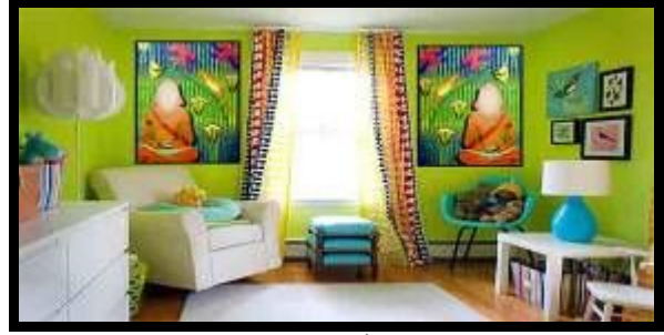
شكل (٢٢) النموذج التوظيفي رقم (٤)

محوره الرأسي، واستخدم العنصر البشري، العنصر النباتي، والعنصر الحيواني، بجانب الخطوط الهندسية وتم ذلك في انسجام تام، واستخدمت مجموعة لونية متميزة من الأخضر، البني، الأصفر، البنفسجي، الأسود والأبيض بدرجاتهم، مع الاستفادة من إمكانات الحاسب الآلي في التقسيمات الهندسية بخلفية التصميم، وتم الجمع بين أكثر من صياغة تشكيلية للعناصر النباتية والحيوانية وللعنصر البشري، وقد تحقق في هذا التصميم بعض الخصائص التشكيلية من الفن المصري القديم مثل: التكرار، المبالغة والتحريف، الشفافية، التسطيح، بجانب بعض الأسس الجمالية للتصميم مثل التنوع، التدرج، الإيقاع، التنوع، التدرج... وتلى ذلك نموذج توظيفي مقترح لاستخدام التصميم بحجرة الطفل.