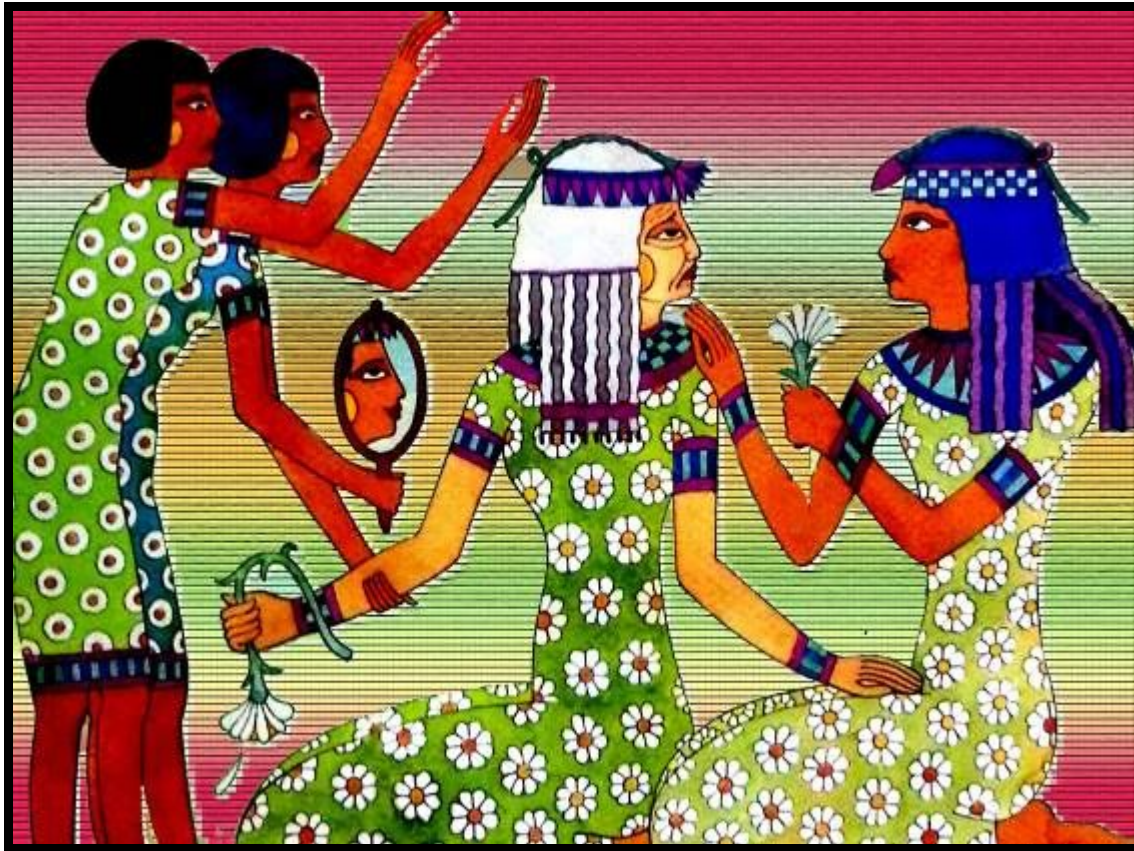
شكل (١٩): تصميم رقم (٣)

هذا التصميم مستوحى من شكل رقم (٦)، واعتمد هذا التصميم على الجمع بين العنصر النباتي المتمثل في زهرة الأفحوان