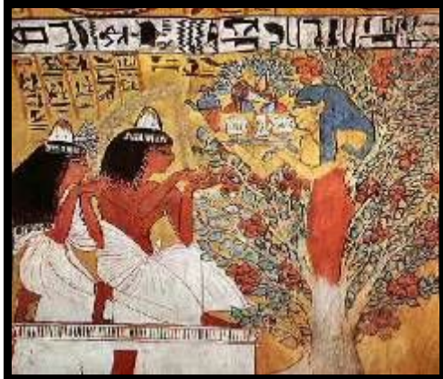
شكل (١٢): رسم جداري ملون على الجبس، مقبرة "سن ند جم" الأسرة ١٩

وقد عرف المصريون طريقة (التختين) للجميز وفيها يقومون بخدش الثمار وهي خضراء بخطاف صغير، فتتضج بسرعة، وتصبح حلوة المذاق. وكانت الشجرة الجميلة المقدسة عند الفراعنة وأسموها (الأم السماوية)، فحرموا قطع جذوعها، وظنوا أن أرواح المتوفين تأوي إليها عند المساء، كما قدموا ثمارها كقرابين للإلهة (Lesko 1999) وكتبوا فيها أشعاراً لتعدد منافعها، وتؤكد ذلك النقوش والرسوم الموجودة على جدران المعابد وبالأخص على مقبرة الأميرة تيتي (Zohary 2000)، واستخدموا خشبها في صناعة الأثاث، التماثيل، السفن، توابيت الدفن، وقد وجدت ثمار الجميز في سلال بتوابيت موتاهم والأوراق أيضاً.