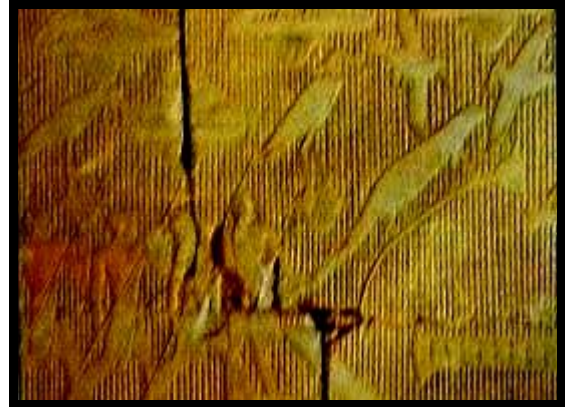
شكل (٨): نقش جداري ملون على الحجر الجيري، مقبرة "ميريوكا" الأسرة ١٤

والجزء المستخدم من النبات هو السيقان، وكثيرا ما نراه منحوتا كطراز للأعمدة كما في (معبد زوسر) بسقارة أو مرسوما علي جدران مقبرة ايبوي في البر الغربي بالأقصر وشكل (٨) يوضح صيد الطيور والأسماك والتمايح وفرس النهر وهي علي نبات البردي حيث وجد ذلك النقش الجداري بمقبرة ميريوكا.