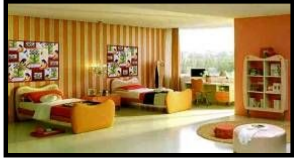
شكل (١٦): النموذج التوظيفي رقم (١)

التمثل في الساق والأغصان والأوراق التي تتفرع بشكل متوازي من مركز واحد لتنتقل بشكل تدريجي كلما اتجهنا إلى أعلى، وكذلك اختلافات أنواع الطيور وزوايا الرؤية بالنسبة لها مما أحدث تنوع في اتجاهات التصميم واستخدمت درجات الألوان من الأزرق، البني والأخضر بدرجاتهم مع الاستفادة من إمكانيات الحاسب الآلي في إعطاء بعض التجسيم وكذلك في خلفية العمل التي تشبه خلية النحل. وقد تحقق في هذا التصميم بعض الخصائص التشكيلية من الفن المصري القديم مثل: التكرار، المبالغة والتحريف، الشفافية، التسطح، التماثل. بجانب بعض الأسس الجمالية للتصميم مثل التنوع، التدرج، الإيقاع، التنوع، التدرج... وتلى ذلك نموذج توظيفي مقترح لاستخدام التصميم بحجرة الطفل.