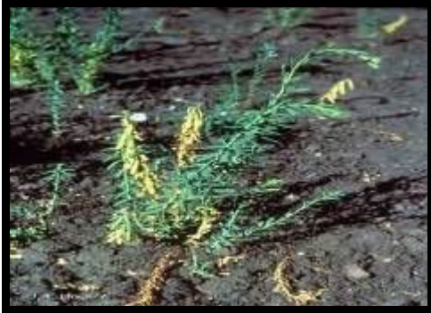
شكل (١): نبات الكتان في الطبيعة

الكتان نبات حولي أو ثنائي الحول أو معمر ينمو برياً كما في شكل (١)، فهو عشب ينمو على مدي عامين يبلغ ارتفاعه متراً، له أوراق رمحية وأزهاره زرقاء أو بيضاء، أصله من جنوب غرب آسيا حيث ينمو بشكل بري وقد بدأت زراعته في مصر منذ عهد ما قبل الأسرات مع بداية الزراعة في وادي النيل، فالجزء المستخدم من الكتان هو الساق الذي تستخرج منه الألياف في عملية تسمى (التعطين) حيث تنقع سيقان الكتان في الماء حتى تتحلل، ثم تضرب بأمشاط من الحديد لاستخراج الألياف البيضاء التي تغزل في شكل خيوط وفي نسج القماش على الأنوال.