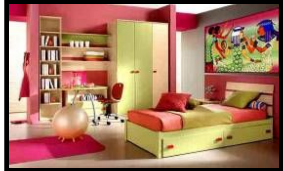
شكل (٢٠): النموذج التوظيفي رقم (٣)

الحيوانية المتمثلة في الطيور والزواحف والعنصر البشري المتمثل في صورة الكاتب المصري، وتم إضافة هاله ضوئية على وجهه رمزاً لأنه الضوء الذي يشع وينشر العلم للعالم، ونلاحظ التنوع في الحركة بالتصميم من خلال الحركة المائلة تارة والخطوط الأفقية والرأسية تارة أخرى، مما أحدث إيقاعاً بالتصميم وقد استخدمت درجات ألوان من اللون الأزرق، الأصفر، الأخضر، الأسود بدرجاتهم، مع الاستفادة من إمكانات الحاسب الآلي في التدرجات اللونية والخلفية الهندسية للتصميم، وقد تحقق في هذا التصميم بعض الخصائص التشكيلية من الفن المصري القديم مثل: التكرار، التسطیح، بجانب بعض الأسس الجمالية للتصميم مثل التنوع، التدرج... وتلى ذلك نموذج توظيفي مقترح لاستخدام التصميم بحجرة الطفل