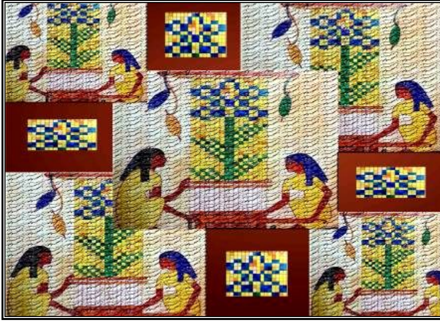
شكل (١٥): تصميم رقم (١)

التمثل في الساق والأغصان والأوراق التي تتفرع بشكل متوازي من مركز واحد لتنتقل بشكل تدريجي كلما اتجهنا إلى أعلى، وكذلك اختلافات أنواع الطيور وزوايا الرؤية بالنسبة لها مما أحدث تنوع في اتجاهات التصميم واستخدمت درجات الألوان من الأزرق، البني والأخضر بدرجاتهم مع الاستفادة من إمكانيات الحاسب الآلي في إعطاء بعض التجسيم وكذلك في خلفية العمل التي تشبه خلية النحل. وقد تحقق في هذا التصميم بعض الخصائص التشكيلية من الفن المصري القديم مثل: التكرار، المبالغة والتحريف، الشفافية، التسطح، التماثل. بجانب بعض الأسس الجمالية للتصميم مثل التنوع، التدرج، الإيقاع، التنوع، التدرج... وتلى ذلك نموذج توظيفي مقترح لاستخدام التصميم بحجرة الطفل.