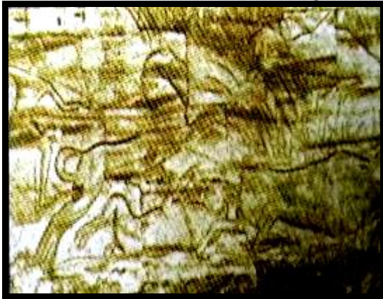
شكل (١٠): نقش جداري ملون على الحجر الرملي، معبد "هابو" الأسرة ١٩

وعرفه قدماء المصريين قبل اكتشاف الزراعة واتخذوا من شكل زهرته عندما تميل مع الريح إحدى العلامات الهيروغليفية وشعارا لمنطقة الدلتا، وقد رسموه علي حواف البرك في عهد الأسرات القديمة والمتوسطة كما في المقابر والمعابد ضمن مناظر صيد وقصص الحيوانات البرية، مثل الأسماك، فرس النهر، الطيور، الثيران، الغزلان، والأرانب والصيد كان يمارسه عامة الشعب، الأمراء، والملوك من أجل الحصول على الغذاء، وكنوع من الرياضة البدنية، وأحيانا للهو والتسلية.