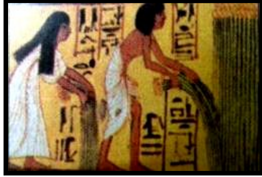
شكل (٢): رسم ملون على الحجر الجيري، مقبرة "سن ند نجم" الأسرة ١٩

سيقان نبات الكتان من جذورها بدقة لئلا يكسروا الألياف مما يدل على استخدامها لصناعة الكتان وحالياً تندر زراعته لذا أصبح غالي الثمن (٢١).