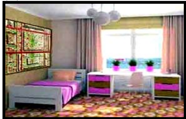
شكل (٢٦) النموذج التوظيفي رقم (٦)