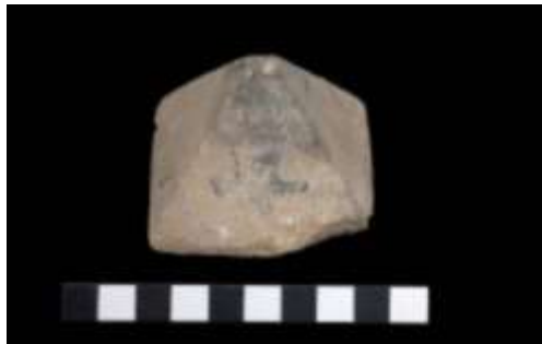
شكل (٦) غطاء هرمي من الحجر الجيري، نقلاً عن:

غطاء ذو شكل هرمي من الحجر الجيري، عُثر عليه داخل الجبانة الأوزيرية في البهنسا وهو محفوظ في المخزن المتحفي بالبهنسا تحمل رقم تسجيل ٢٤٦، علي أحد جوانبه بقايا علامات بالخط الديموطيقي باللون الأسود، تشير إلي الجهة الغربية \overline{\text{Imntt}} \text{ II I } \overline{\text{A}} ، يبلغ طول القاعدة ٦,٥ سم و الأرتفاع ٥,٥ سم 21 (شكل ٦).