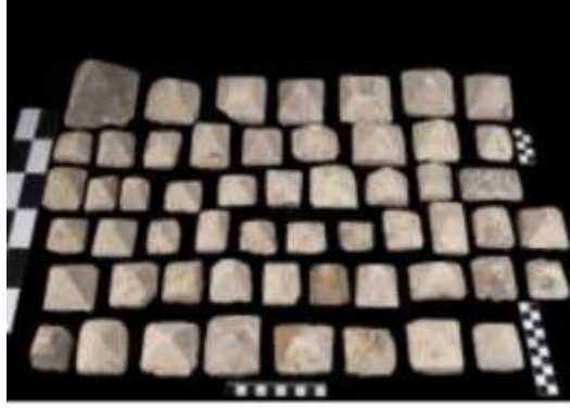
شكل (٥) مجموعة من أغطية هرمية من الحجر الجيري، نقلاً عن:

هم عبارة عن ٥٥ غطاء صندوق من الحجر الجيري ذات شكل هرمي و بدرجات ميل مختلفة، عُثر عليهم داخل الجبانة الأوزيرية بالبهنسا تم حفظهم داخل المخزن المتحفي بالبهنسا تحمل رقم تسجيل ٢٤٥، و يبلغ قياسهم ما بين ٤×٣، ٤×٣ سم و ١٢×١٢×١٠ سم ، وهذا الغطاء كان يستخدم لغلق صندوق الحجر الجيري الذي يحفظ الكرة السحرية من الطين التي تستخدم في طقسة رمي الكرات الأربع لحماية الإله أوزير، و يوجد تجويف داخل الغطاء يشبه التجويف الذي في وسط الصندوق الحجري 20 (شكل ٥).