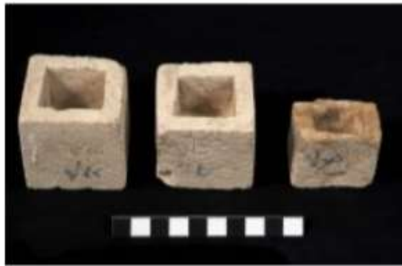
شكل (٤) صناديق من الحجر الجيري فارغة من الكرات وبدون أغطيتها ، نقلًا عن:

٣ صناديق من الحجر الجيري عُثر عليهم داخل الجبانة الأوزيرية و تم حفظهم داخل المخزن المتحفي بالبهنسا تحمل رقم تسجيل ١٩٤، ويبلغ قياس الصندوق الأول ٦×٦×٦ سم، ويبلغ قياس الصندوق الثاني ٦×٥.٨×٥.٦ سم، ويبلغ قياس الصندوق الثالث ٦×٤×٤.٥ سم، وعلي الجوانب الخارجة توجد كلمة تحدد أحد الإتجاهات الأربع بالخط الديموطيقي بالحبر الأسود، وتم الكتابة علي أكبر مربعين بالحبر علي جهتين اثنين منها، و الثالثة عليها كتابة من أربع جهات، وقد كُتبت علي إحداها اسم الجهة الشرقية \overline{\text{II}} \text{I} \overline{\text{I}} وأخري كُتب عليها اسم الجهة الجنوبية \text{RSY} \overline{\text{II}} \text{I} \overline{\text{I}} وأخري كُتب عليها اسم الجهة الشمالية \text{Mhyt} \overline{\text{II}} \text{I} \overline{\text{I}} 19 (شكل 4).