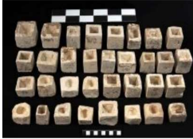
شكل (٣) صناديق من الحجر الجيري فارغة من الكرات وبدون أغطيتها ، نقلًا عن:

Roca, M.M: L'osireion d'oxirrinc, P.481.