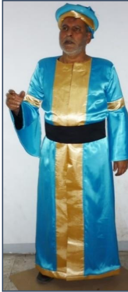
شكل (٣) تنفيذ زي شخصية السلطان

يظهر زي شخصية السلطان كما يوضح الشكل (٢) التصميم بعد التعديل وقد قامت الباحثة بتصوره وفقاً لرؤية المخرج وكى يتناسب مع ميزانية العرض، حيث اختارت لوناً جذاباً مثل اللون الأزرق الفاتح لمحاكاة العصرية في التصميم وإضافة قميص وسروال كملابس داخلية حتى