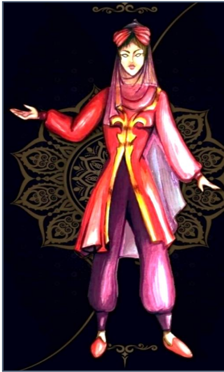
شكل (١٣) يوضح المعالجة التشكيلية الحديثة لزي شخصية حبيبة الساقية ويعتمد على المزج بين اللونين الزهري والوردي

تتميز شخصية حبيبة الساقية بالجمال واللفظ والأنوثة، لذا قامت الباحثة بتصميم الزي باللون الوردي بالإضافة للسروال الفضفاض لتسهيل حركتها وأداء بعض الحركات الراقصة، "حيث كان يرتدى النساء في العصر الصفوي السروال الواسع الفضفاض ويصنع من الحرير وبألوان زاهية" (٩) ، ومع إضافة العمامة الوردية والوشاح الشفاف أصبح الزي مختلف من حيث المعالجة، وبالرغم من ذلك إلا أن تثبيت العمامة المتصلة بالخمارة يوحى بالطراز العربي ويظهر الهيئة التراثية للزي، فلا يفقد الزي هويته العربية بالرغم من المعالجة الحديثة للتصميم، تعد إضافة الوشاح أحد أهم الإضافات حيث يتطلب الثوب العديد من الطبقات لإظهار أن مفاتها مغطاة ومخبئة بين الطبقات المترامية نوعاً من جذب الانتباه وإثارة الفضول، وتمت معالجته بشكل عصري مع التطريز على الصدر والخمار الشفاف والذي قامت الباحثة بجعله فيه قدر من الشفافية للتأكيد على صفات الشخصية فهي لطيفة وأنثوية ولكنها ليست فتاة بغاء فهي تستتر بقدر كذلك وإن كان ضئيلاً أو غير مخفى في حقيقته، وحقيقة ارتدائها السروال الفضفاض تحت الملابس والذي "كان يسمى التكة، لما فيه من رباط يسمى التكة وفي العادة يرتديه النساء أسفل ملابسهم، فاستعملتها الجوارى الراقصات إلى جانب الأميرات كملابس داخلية يغطيها رداء خارجي" (١٠) ، وظهر ذلك في الزي المخالف لصفات الثياب النسائية لهذا العصر في فكرة أن يكون السروال ظاهراً دون تغطيته بثياب خارجية، مما يؤكد التصميم الحديث في ذلك العصر، ويظهر التصميم بشكل (١٣).