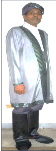
شكل (١٢) زي ابن عم

أما بالنسبة للتصميم اللاحق فإن الألوان تختلف كثيراً فقامت الباحثة بعمل تصميم فيه يظهر المعطف باللون الرمادي الفاتح والكنار مخطط والقميص أبيض والسروال والحزام رمادي