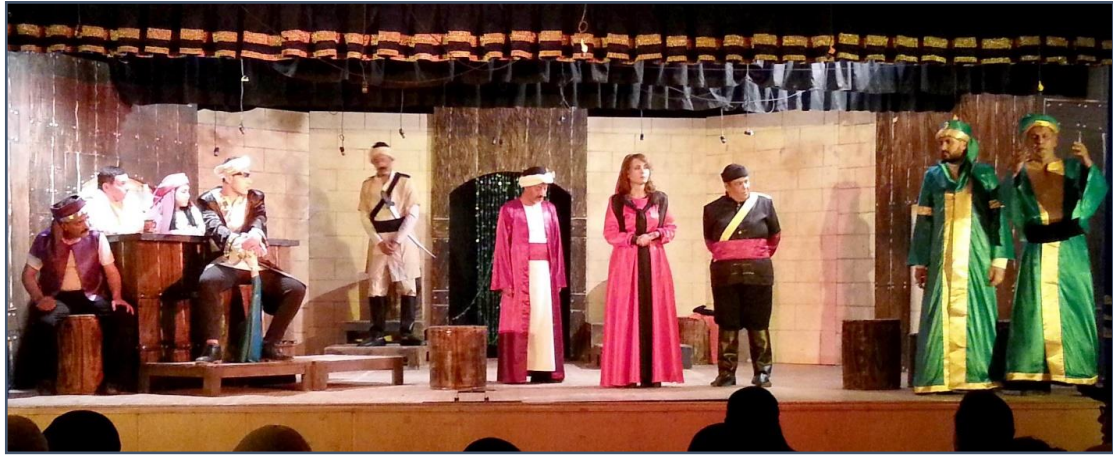
شكل (٢٨) الشكل عبارة عن مجموعة صور مختارة من العرض المسرحي السلطان يلهو وفيها تظهر الأزياء بعد تنفيذها وأثناء العرض .