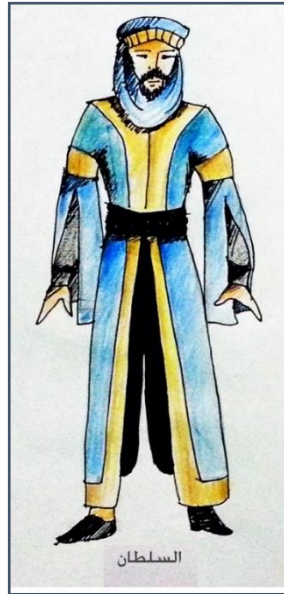
شكل (٢) تصميم زي شخصية السلطان.

يمكن من تغيير هيئته بسهولة دون إضاعة للوقت بالإضافة للعمامة مع الوشاح ليغطي وجهه كيفما يشاء، وفيه التزمت الباحثة بتصميم الزي بشكل بسيط يؤكد الدلالة الدرامية لزي شخصية السلطان والأكمام المشقوقة والعباءة التي يظهر من تحتها السروال تعبر عن الخبايا التي تخفيها الشخصية والكنار الذهبي يوضح الترف الذي يغلف الشخصية وكأنه لوحة يحدها إطار ذهبي، بينما يظهر في شكل (٣) تنفيذ الزي على المسرح لشخصية السلطان وفقاً للتصور الأولى للشخصية ونلاحظ دقة التنفيذ المحاكي للتصميم الأولى بالإضافة لحذف بعض التفاصيل مثل الوشاح وشقوق الأكمام والسروال، إلا أن التنفيذ لم يكن يختلف كثيراً عن التصميم.