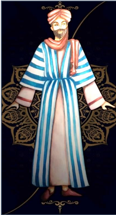
شكل (٢٤) يوضح تصميم زي شخصية حمدون الحكيم.

قامت الباحثة بعمل تصور للشخصية، والذي يظهر في العرض بصورة ناصحة وحكيمة فهو صوت العقل والحكمة " حيث كان زي العامة يتوسط بين الأغنياء ومتوسطي الحال والفقراء، فالأغنياء يرتدون القميص ورداء فوق السراويل المصنوعة من الحرير، والفقراء والخدم الثياب المخططة، وأما متوسطو الحال فقد كانوا يرتدون الإزار والقميص والدراعة بالإضافة إلى الجبة والنعال والجوارب والقباء" (١٢) ، إذ تراءى للباحثة أن العباءة المخططة طولياً باللون الأزرق والأبيض المغلقة بحزام أزرق رفيع مناسبين تماماً لإضفاء السلام والحكمة والطمأنينة والرسوخ بالشخصية والثوب الأبيض البسيط مع خطين بالأساور توازناً مع العمامة الحمراء بحيث يظهر على الزي باطن الشخصية وما تحمله من حكمة ووقار وظهر التصميم بشكل (٢٤).