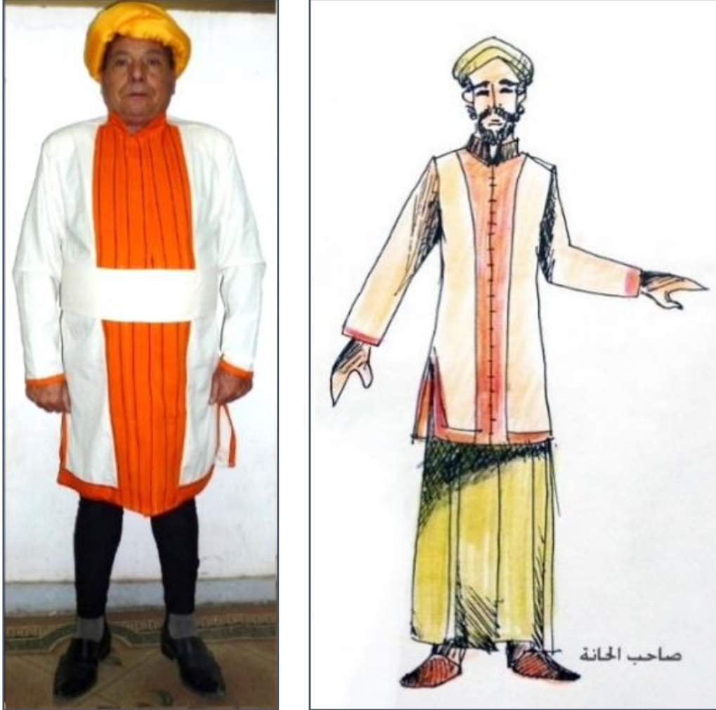
شكل (٢٧) يوضح تصميم زي صاحب الحانة على اليمين وعلى اليسار بعد تنفيذه علي المسرح.

قامت الباحثة بعمل تصميم لاحق لزي بسيط لشخصية صاحب الحانة وفيه يرتدى ثوب طويل وفوقه تونيك بسيط أبيض وبه خط طولي وكنار عريض برتقالي وتم تنفيذ الزي على غرار التصميم الأولي بعد تبديل الثوب بسرwal أسود ضيق وعمامة برتقالية فاتحة وحزام ابيض عريض، ويبدو التصميم أكثر بساطة وذلك ليتناسب مع ميزانية العرض ويظهر بشكل (٢٧).