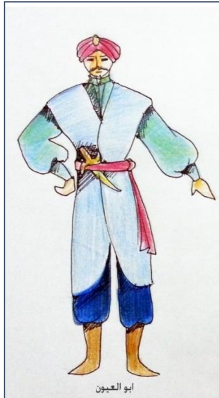
شكل (١٧) تصميم زي شخصية أبو العيون على اليمين، وعلي اليسار الزي الذي تم تنفيذه في العرض المسرحي.