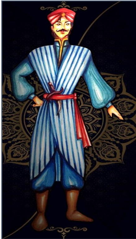
شكل (١٦) تصميم زي شخصية أبو العيون.

تأتى شخصية أبو العيون بكثير من الغموض في العرض، حيث يقوم أبو العيون بالتمرد على السلطان وعلى القانون ظناً منه أن البلاد لا يسود فيها العدل والديموقراطية وأن العديد من الناس يعانون جراء أهواء وتقلبات السلطان المزاجية، قامت الباحثة بعمل تصميم حديث لزي شخصية أبو العيون وفيه قامت بتصميم الزي باللون الأزرق السماوي وهو لون من وجهة نظر الباحثة لون يرمز للعدل وللصدق وللحرية فهو لون السماء وفيه رمزية للعلو وللسمو ورأت الباحثة أن التصميم مشابه للتصميم الأولى بالإضافة لبعض التفاصيل مثل الكنار الذهبي على الكولا والإبقاء على العمامة والحزام الأحمر، والسروال الأزرق كذلك، كما قامت الباحثة بتصميم الصديري بخطوط طولية تعبر عن السجن النفسي الذي يفقد الشخصية ويثبطها وفيه الكثير من العصرية والتطور مما يكسب الزي طابعاً حديثاً ومميزاً، ويظهر في شكل (١٦).