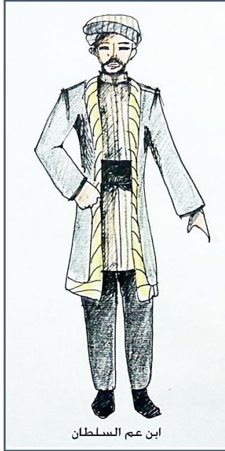
ابن عم السلطان