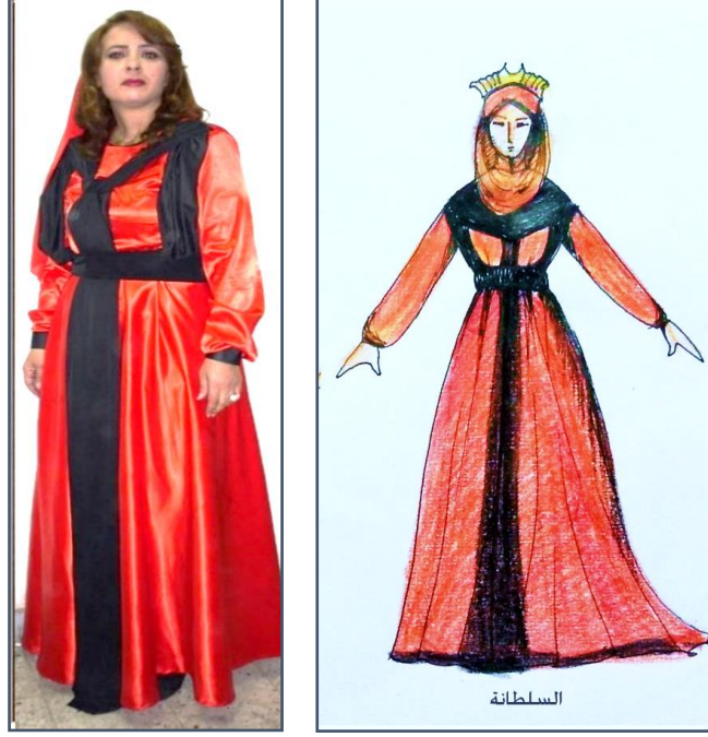
شكل (٦) زي شخصية السلطانة بعد التنفيذ.