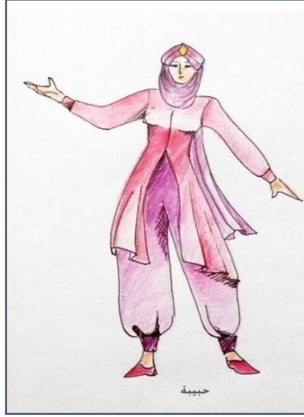
شكل (١٤) تصميم زي شخصية حبيبة. شكل (١٥) تنفيذ زي شخصية حبيبة.