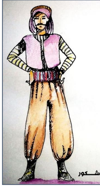
شكل (٢٢) تصميم زي شخصية اللص شكور.

ويظهر التصميم اللاحق بشكل (٢٢) بينما يظهر بشكل (٢٣) شخصية اللص شكور بعد تنفيذها على المسرح ويلاحظ دقة التنفيذ طبقاً للتصميم الأولى بدأً من القميص المخطط والصديري البنفسجي مع العمامة، فقط اختلف السروال إلى سروال باللون الأسود وكان ذلك تأكيداً على غموض الشخصية بحيث يخدم المعنى الدرامي ويبرز التناسق اللوني ويحقق تبايناً لونياً أفضل من السروال الفاتح، مع إضافة الأساور السوداء بحيث يبدو مكبلاً بالأغلال والحزام الأسود والوشاح كذلك يضيفي إطلالة عربية.