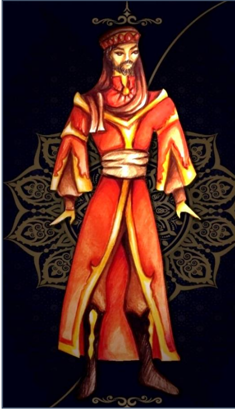
شكل(١) تصميم زي شخصية السلطان.

قامت الباحثة بعمل تصميم لزي شخصية السلطان، تظهر فيها المعالجة الحديثة لزي الشخصية حيث قامت الباحثة بتصميم الزي باللون الأحمر وهو لون جذاب أكثر إثارة وقوة وللتأكيد على تمييز السلطان وفيه قامت الباحثة بتصوير السلطان بلوحة عصرية تماماً، مما يسمح بتداخل الملابس العربية التقليدية للطراز المملوكي بالاقتران بالعصرية الملائمة وبقليل من البهرجة، بحيث يتم التميز على الفور بين زي وهيئة الملك وبين بقية الشخصيات، بالمحافظة على السروال والأكمام المشقوقة والعمامة ذات الوشاح والتاج، وهي مقتبسة "العمامة الصفوية"، وهي غطاء رأس له هيئة خاصة، استعملت من قبل في بلاط بلاد فارس قديماً وكان يتوج بها الملك نفسه، وهي مصنوعة من الصوف ويحدها صف من الجواهر والأحجار الكريمة، ويطلق عليها اسم تاج تومار، ومعناه عقاب ملفوف (٤) ، وكما تميز التصميم بالخطوط الحادة والفتحات المثلثة مما ينتج عنه إضافة الشعور بالقلق والتوتر والاهتزازية الشخصية وبأبسط عنصر من عناصر التصميم وهو الخط وذلك التوتر الناتج عن مكنون الشخصية والتي تظهر في أبهى حلة لتغطي فئسها وخوائها، ويظهر في شكل(٣).