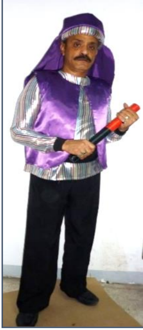
شكل (٢٣) تنفيذ زي شخصية اللص شكور.