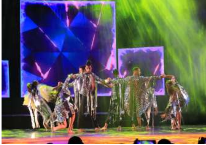
(صورة ٧) صورة من ختام المهرجان القومي للمسرح التجريبي - تصميم أزياء الباحثة -توضح تأثير الإضاءة علي الازياء- دار الاوبرا المصرية ٢٠٢٣