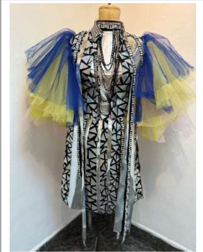
(صورة ٩) اصوره لافستان من أزياء المهرجان التجريبي - تصميم الباحثة - المعرض الفردي بمتحف احمد شوقي - قطاع الفنون التشكيلية.