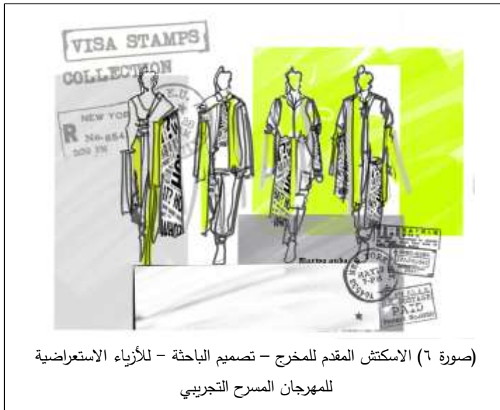
(صورة ٦) الاسكتش المقدم للمخرج - تصميم الباحثة - للأزياء الاستعراضية للمهرجان المسرح التجريبي

الاستفادة من التأثيرات الضوئية: تم تصميم أزياء تتفاعل مع الإضاءة بشكل مبتكر ، حيث استخدم الأقمشة ذات المعان الفضي لإنشاء تأثيرات بصرية فريدة عندما يتعرض الضوء للأزياء فهي أقمشة عاكسة للضوء لإضفاء لمسة على التصميمات.