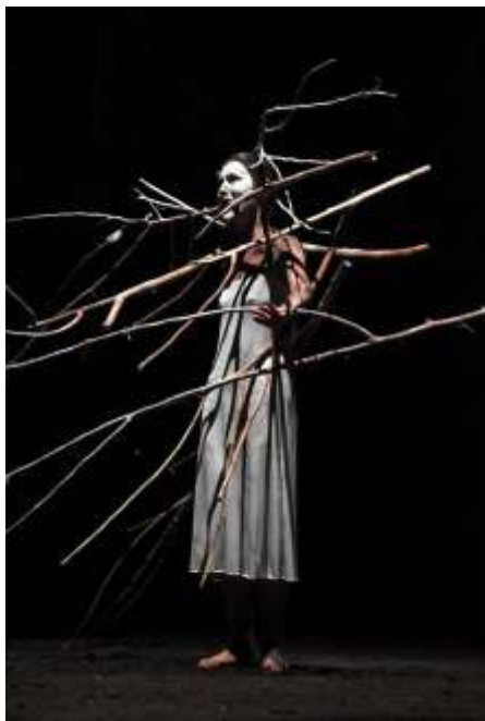
(صورة ٣) العرض الروسي زمن العجائب - مهرجان المسرح التجريبي ٢٠١٧

٤. أزياء متفاعلة: يمكن استخدام التقنيات الحساسة للحركة واللمس لإنشاء أزياء متفاعلة في المسرح. يتم تضمين أجهزة استشعار في الأزياء للتفاعل مع حركة الممثلين أو لمس الجمهور، مما يخلق تأثيرات بصرية وصوتية مبتكرة.