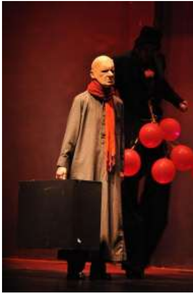
(صورة ١) العرض العراقي - السويدي ركائز أعمدة الدم - مهرجان المسرح التجريبي ٢٠١٦

في تصميم الأزياء الاستعراضية في المسرح التجريبي، غالبًا ما يتم التركيز على الجوانب الفنية والتعبيرية بدلاً من الواقعية. يتم استخدام الألوان الزاهية والمبهجة، والأشكال المجردة والغريبة، والمواد غير التقليدية لخلق تأثيرات بصرية قوية ومثيرة. يمكن أن تشمل الأزياء الاستعراضية في المسرح التجريبي الأزياء المتطابرة والمهيبية والمذهلة، والتي تساهم في إنشاء عوالم خيالية وفريدة.