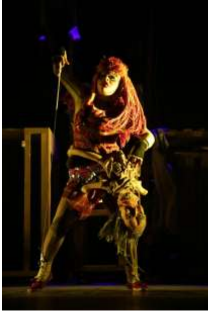
(صورة ٢) العرض الاماراتي تحولات حالات الاحياء والاشياء - مهرجان المسرح التجريبي ٢٠١٦

٣. أزياء مطبوعة ثلاثية الأبعاد: باستخدام تقنية الطباعة ثلاثية الأبعاد، يمكن إنشاء أزياء فريدة من نوعها بتفاصيل معقدة وهندسة مبتكرة. يتم إنشاء الأزياء طبقة طبقة باستخدام الطابعات ثلاثية الأبعاد، مما يتيح للمصممين إمكانية تحقيق تصاميم معقدة وغير تقليدية.