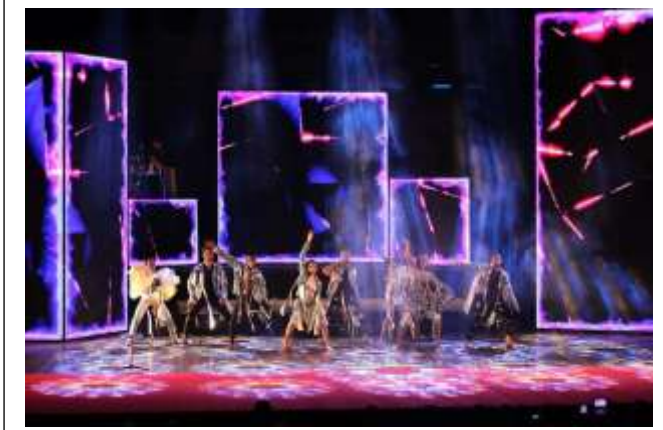
(صورة ٥) صورة من ختام المهرجان القومي للمسرح التجريبي - تصميم أزياء الباحثة - دار الاوبرا المصرية ٢٠٢٣

٤. تناسق الأزياء: يمكن استخدام تناسق الأزياء لنقل رسالة مشتركة أو لإيجاد توازن في العرض. على سبيل المثال، قد يكون للأزياء تصميمات متماثلة أو ألوان متناسقة تمثل التلاحم والتكامل. يمكن أيضًا استخدام تباين الأزياء لتمثيل الصراع أو التوتر بين الشخصيات أو الأفكار في العرض.