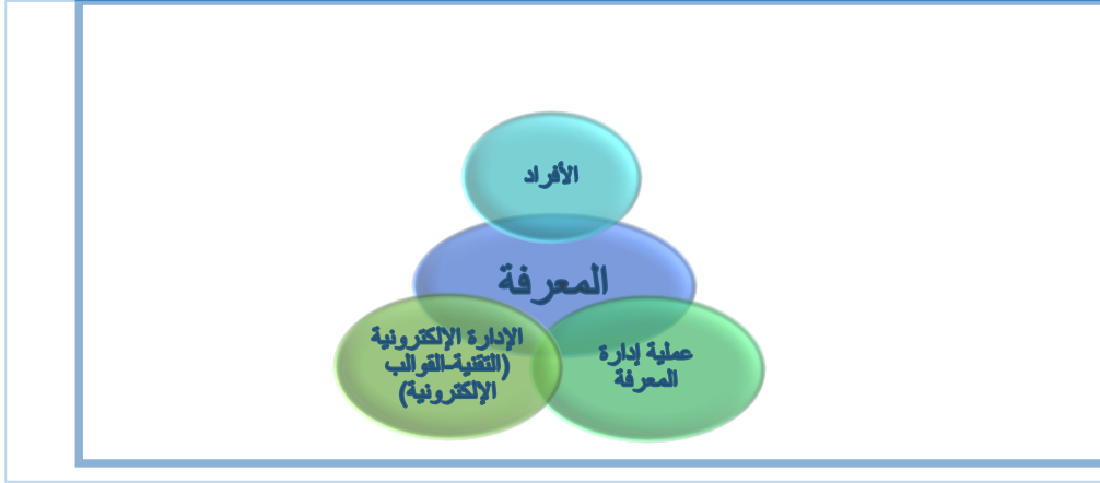
شكل رقم (١) تكامل أدوات خلق المعرفة، بالاستفادة من (الفليت، ٢٠١٨).

يتضح من الشكل السابق أن هناك ترابطاً وتكاملاً بين العناصر الثلاثة: الأفراد، وعمليات إدارة المعرفة، والإدارة الإلكترونية المتمثلة في التقنية المتضمنة القوالب الإلكترونية، فكلُّ منها يُؤثِّر ويتأثَّر بالآخر، فإدارة المعرفة والإدارة الإلكترونية وجهاً لعملة واحدة، فتطبيق عمليات إدارة المعرفة بحاجة إلى الجزء التقني المتمثل في القوالب الإلكترونية المحوكة التي تُمكن من تنفيذ مختلف الإجراءات الإدارية بكل يسر وسهولة ودقة، ويُوفِّر ذلك بيئة معرفية متجددة تُحسِّن من جودة القرارات المتخذة، وترتقي بمستوى الخدمات المقدمة للمستفيدين، وتطبيق عمليات المعرفة باستخدام الشبكات والقوالب الإلكترونية والبرمجيات المختلفة في المؤتمرات الافتراضية والاجتماعات واللقاءات عن بُعد، والورش التدريبية الافتراضية (رحماني، ٢٠٠٩)، ويُمكن ذلك من سرعة تبادل ومشاركة المعرفة المتخصصة، ويدعم انتشارها وتدققها وفق آليات محدَّدة تحفظ الحقوق وأمن وسرية المعلومات المعرفية (العوض، ٢٠٠٥)، ويتمُّ ذلك بطرق وأساليب عدَّة منها التالي: الإنترنت، البرمجيات الجماعية، أدوات مؤتمرات الويب، برمجيات الفريق، البريد الإلكتروني، برنامج زوم وتيمز (زلمات، ٢٠١٠).