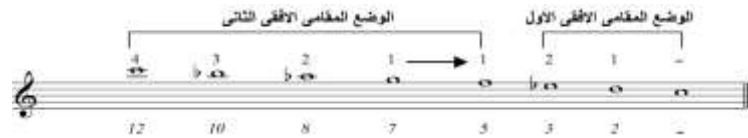
شكل رقم (٢)

مقام نهاوند بالوضع المقامي الأفقي (وتر الكردان) هبوطاً