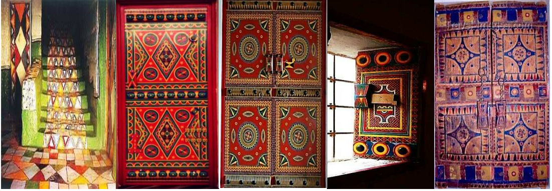
صورة (٣) زخارف الأبواب النجدية.