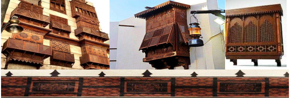
صورة (٤) زخارف الرواشن (الحجاز).

- الرواشن (الحجاز): الرواشن عبارة عن وحدات شبه صندوقية بارزة في الفراغات الخارجية لواجهة المنازل، تتدرج رأسياً وأفقياً بحيث تلقي بظلالها على جدران المنازل، وتعد الرواشن الخشبية أحد فنون العمارة الإسلامية في المملكة العربية السعودية، فهي مصدر الإضاءة، حيث تنكسر من خلالها حدة الضوء على حواف الفراغات الزخرفية التي تزيينها، كما أنها تقلل من حدة الحرارة، ولها عناصر زخرفية مميزة في الشكل ومنمقة في الصنع (صالح محمد ٢٠١٣م).