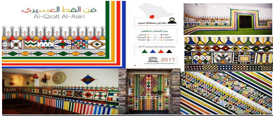
صورة (٢) زخارف القط العسيري

- القط العسيري : يعد التراث العسيري من أحد أهم الزخارف الفنية؛ لما يتمتع به من ثراء وقيم فنية وجمالية تجعله مصدرا للإبداع والابتكار. وتعتبر منطقة عسير مركزا له، حيث تذخر جدرانها بالنقوش الفنية التشكيلية التي تتنوع ما بين الأشكال الهندسية والزخارف النباتية الشعبية، فهو فنٌ تجريدي لا تتمثل فيه أشكال العالم المادي (فاطمة عبدالله ٢٠٢١م). وعُرف فن القط العسيري منذ مئات السنين تحديدا في بلاد تهامة على يد المرأة العسيرية، وأدرجته منظمة اليونسكو عام ٢٠١٧م ضمن قائمة التراث الثقافي غير المادي (هناك كامل، منتهى صالح ٢٠٢٠م). ويتكون القط العسيري من نقوش أساسية تتمثل في (البتره - التقطيع العمري - الحظية - الختام)، وتتخلل هذه النقوش مفردات تتمثل في (الأرياش - الأمشاط - البلسنة - البناة - الركون - السنكرولي - الشبكة - المثالث - المحاريب - المخامس)، واستخدمت فيها الألوان الأساسية: الأحمر - والأزرق - والأصفر، والألوان الثانوية: البرتقالي - والبنفسجي - والأخضر (منى محمد ٢٠٢٠م).