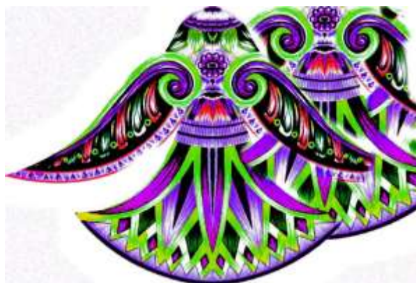
شكل رقم (٣) زهرة البشنين