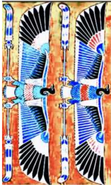
شكل رقم (٢) العقاب المصري