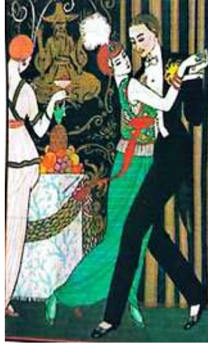
شكل رقم (٢) يبين لوحة باسم الراقصة لجورج بايير ١٩١٤ الإطار التطبيقي :

اتجه الفنانون الى التبسيط والتلخيص لعناصر من الطبيعة لتصبح مجرد رمز أو مفردة تشكيلية تستخدم في طباعة المنسوجات أو في فن الإعلان أو لتصميم شعارات، وكذلك تناول فناني الطراز الزخرفي هذا المفهوم حيث الإعتماد على المفردات أو العناصر التي يتم أخذها من الطبيعة أو من فنون الحضارات الشرقية ويعاد تبسيطه أو تلخيصها ثم توظيفها في صياغات تشكيلية جديدة. كما بشكل (١٢٠)