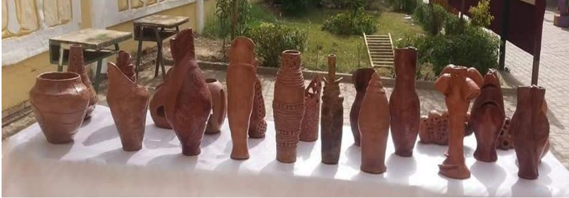
شكل رقم (١ - أ)

يوضح نماذج الأعمال الفرديه (التجربه القبليه) لطلاب الفريق الأول