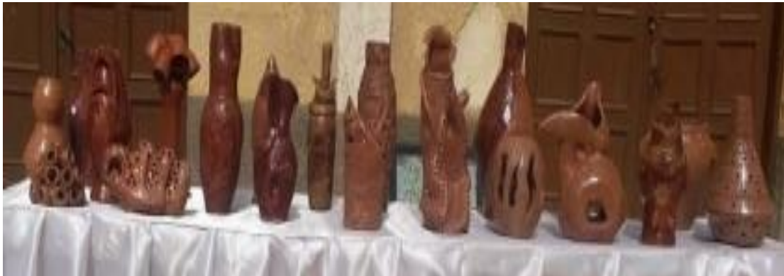
شكل رقم (١ - ب)