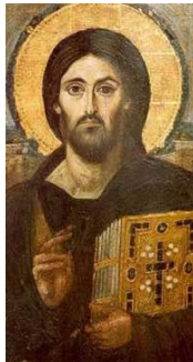
شكل ( 1 ) ايقونة بركة السيد المسيح - 84 × 45.5 سم تثبيت حرارى بالشمع المذاب على الخشب - القرن السادس الميلادى دير سانت كاترين

بدأ العامة يتجهون ناحية تقديس الايقونات لدرجة العبادة الصنمية مما حدا ببعض الاساقفة انفسهم ان يرفعوا الايقونات و يحطموها