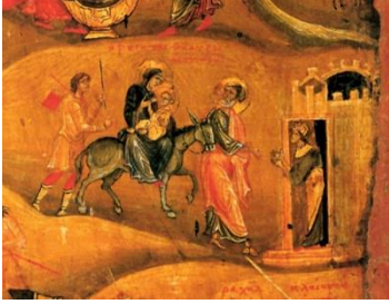
شكل (3) رحلة العائلة المقدسة - القرن 12 - فن بيزنطى

الخلفية شخص يدعى يوسى و هنا نرى ان الفنان اظهر عمر السيد المسيح بانه صبي و ليس طفل رضيع كما باقى ايقونات رحلة العائلة المقدسة و هنا يدل على انها رحلة العوده و ليستة الدخول و نرى ان ملابسهم تقليدية ما عدا السيدة العذراء فا انها بوشاح اسود و ليس ازرق او احمر كالايقونات الاخرى و هنا لا نرى اى علامات تدل على وجودهم فى مصر و نرى ان تكوين الايقونة مستطيل رأسى