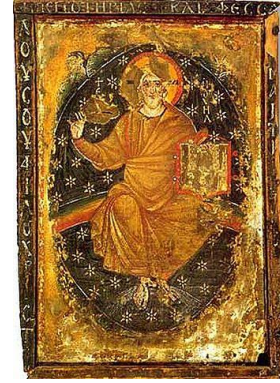
شكل (2) ايقونة كليه للسيد المسيح - 76 × 53.5 سم تثبيت حرارى بالشمع على خشب مجهز - بداية القرن السابع الميلادى دير سانت كاترين - سيناء

ذلك ما زلت تكتشف بعض الايقونات من هذه الفترة بين الحين و الاخر