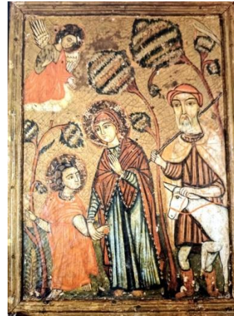
شكل ( 5 ) العائلة المقدسة او الايقونة الفريدة – 58 × 41 سم

الارمن او الروم او الايطاليين و منهم يوحنا الارمانى و هو من مشاهير مصورى الايقونات فى هذا الوقت