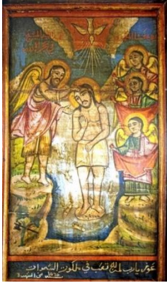
شكل ( 7 ) عماد السيد المسيح – 45 × 25 سم – 1849 م

نرى في هذا القرن عدداً من الايقونات من تصوير انسطاسى الرومى القدس و هو من اصل يونانى من القدس و قد عمل فى مصر بين عامى 1832 – 1871 م و غالباً ما يكتب اسمه فى شكل شريط اسفل الايقونة