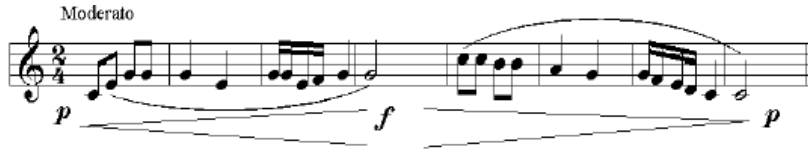
شكل رقم (7) جملة لحنية

تقوم الباحثة بكتابة جملة لحنية مكونة من ٨ موازير على السبورة ثم تطلب من أحد الطلاب غنائها ويقوم الطلاب جميعهم بغنائها بعد ذلك وهي كالتالي: