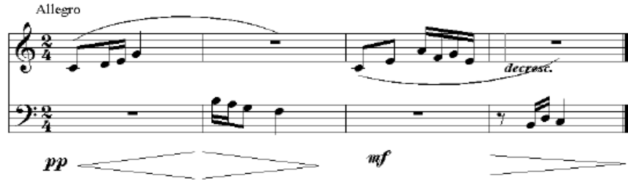
شكل رقم (3) تمرين قراءة صولفائية

وفيه تقوم الباحثة بكتابة تمرين على السبورة يتعرف عليه الطلاب ويقوموا بقراءته صولفائياً مع الباحثة وذلك لعدة مرات متتالية حتى يتم إتقانه.