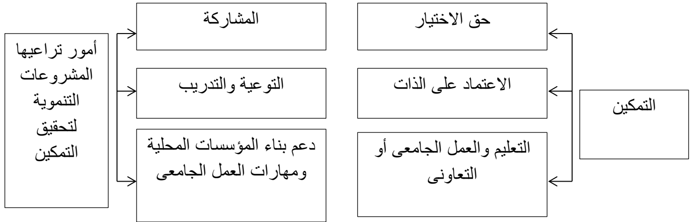
شكل رقم (٢) يوضح أبعاد التمكين فى الخدمة الاجتماعية

وإذا كانت الأبعاد الثلاثة الأولى تحدث تغييراً على المستوى الفردى الميكرو المصغر Micro level فإن البعد السياسى يتم تحقيقه على المستوى المجتمعى الماكرو Macro level ويضيف Lephoto أن معدلات التمكين تختلف باختلاف أبعاد التمكين (صابر ، ٢٠١٥ ، ١٣٩ ) ويمكن تلخيص أبعاد التمكين فى الشكل التالى(صندوق الأمم المتحدة الإنمائى للمرأة ، ١٩٩٩ ، ٥) :