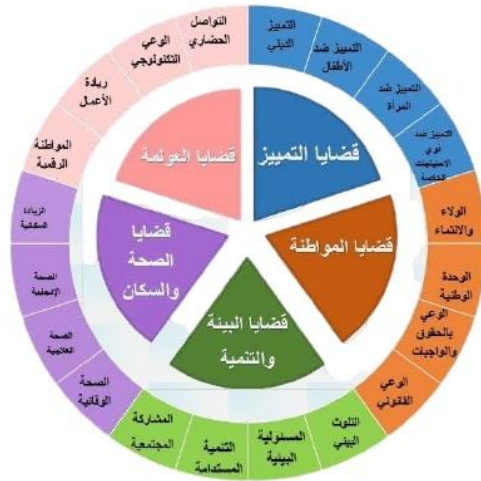
شكل (٩): القضايا والتحديات بمنهج رياض الأطفال (2.0) وفق أبعاد التعلم الأربع

يتضمن الإطار العام لمنهج رياض الأطفال (2.0) خمس قضايا وتحديات رئيسية: التمييز، المواطنة، والبيئة والتنمية، والصحة والسكان، والعولمة، مصنفة وفق أبعاد التعلم الأربع، كما يتضح بشكل (٩) (مركز تطوير المناهج والمواد التعليمية، ٢٠١٨، ص ٣٨).