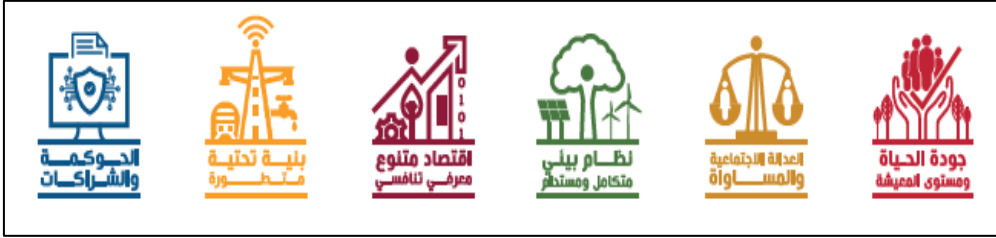
شكل (٣): الأهداف الاستراتيجية في رؤية مصر ٢٠٣٠ المحدثه

ترتكز رؤية مصر ٢٠٣٠ المحدثه على ستة أهداف استراتيجية. تُمَثِّل توجّهات الدولة نحو مواصلة تحقيق التنمية المستدامة، ينبثق منها (٣٢) هدفاً عاماً، تتكامل فيما بينها، وتتناغم مع توجّه الدولة نحو بناء الإنسان المصري، وتصبُّ جهود تنفيذ الأهداف العامة في تحقيق الأهداف الاستراتيجية، ويمكن توضيح الأهداف الاستراتيجية الستة بالشكل التالي (وزارة التخطيط والتنمية الاقتصادية، ٢٠٢٢، ص ٣):