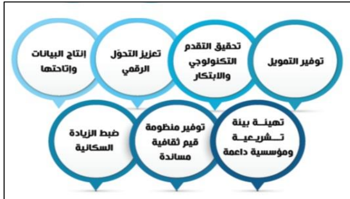
شكل (٢): المُمكنات في رؤية مصر ٢٠٣٠ المحدثه

تُمثّل المُمكنات في رؤية مصر ٢٠٣٠ المُحدثه المتطلبات الضرورية والأدوات المُقترحة لتنفيذ السياسات والمبادرات والبرامج، لتضمن فاعلية عملية التطبيق وكفاءتها، وتُحقّق الرؤية بسلاسة ويسر، وتتمثّل في سبع ممكنات كالتالي (وزارة التخطيط والتنمية الاقتصادية، ٢٠٢٢، ص ١٩):