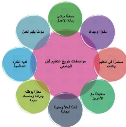
شكل (٦): المواصفات التي يجب أن يتمتع بها طفل الروضة كخريج للتعليم قبل الجامعي

يتضمن الإطار العام لمنهج رياض الأطفال (2.0) ، جملة من المواصفات التي يجب أن يتمتع بها طفل الروضة-كخريج للتعليم قبل الجامعي- والتي تؤهله للحياة الناجحة والعمل الكفاء في القرن الحادى والعشرين، يمكن توضيحها في الشكل التالي(مركز تطوير المناهج والمواد التعليمية، ٢٠١٨، ص ١٨):