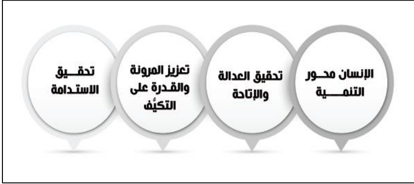
شكل (١): المبادئ الحاكمة في رؤية مصر ٢٠٣٠ المحدثه

تتبنى رؤية مصر ٢٠٣٠ المحدثه أربعة من "المبادئ الحاكمة"، التي تُمثّل الإطار الذي يربط الأهداف الاستراتيجية الستة للرؤية، ويمكن توضيح المبادي الحاكمة بالشكل التالي (وزارة التخطيط والتنمية الاقتصادية، ٢٠٢٢، ص ١١):