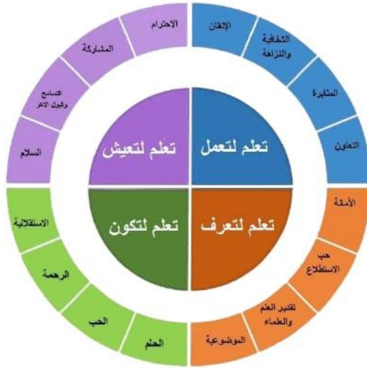
شكل (٨): القيم بمنهج رياض الأطفال (2.0) وفق أبعاد التعلم الأربع