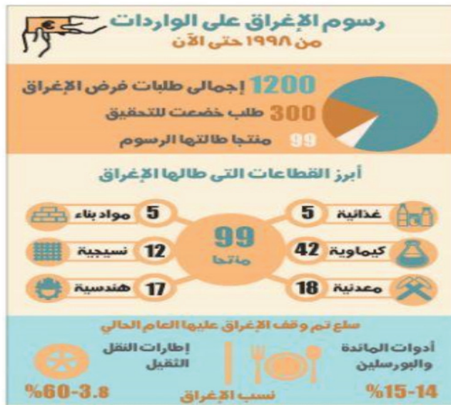
شكل رقم (٣)