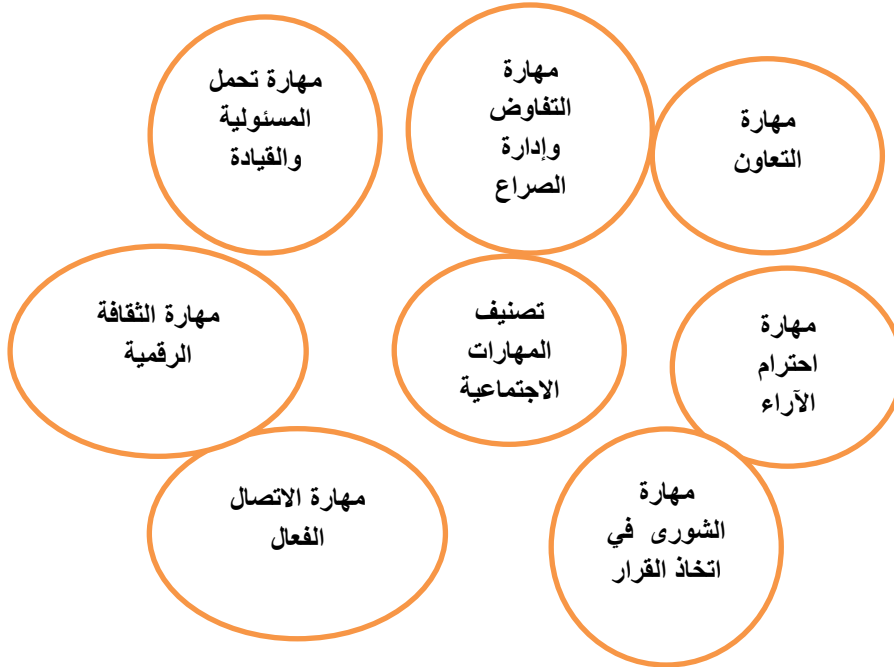
شكل (١) تصنيف المهارات الاجتماعية ( من تصميم الباحث )

ويمكن وضع تصنيف للمهارات الاجتماعية وذلك كما هو موضح في الشكل التالي :