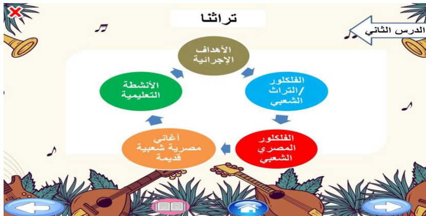
شكل (٥) يوضح شاشة طريقة سير الدرس في الحقيبة التعليمية