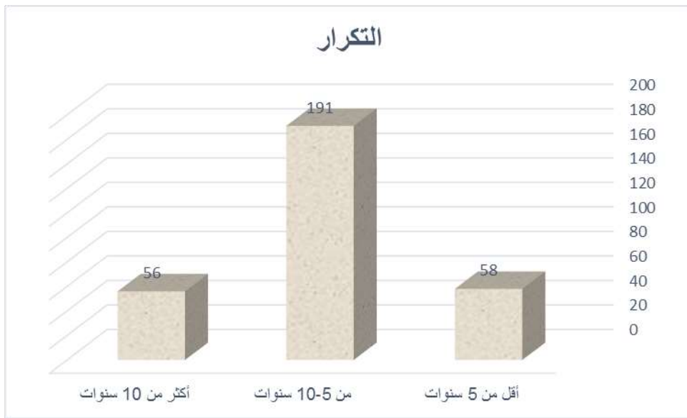
شكل (٢) يوضح توزيع أفراد العينة طبقاً لمتغير سنوات الخبرة

يتضح من الجدول (٢) أن أعلى نسبة من إجمالي أفراد العينة من العاملين حسب متغير سنوات الخبرة فئة أكثر من ٥-١٠ سنوات بعدد ١٩١، وبنسبة ٦٢,٦%، تالتهأ أقل من ٥ سنوات بعدد ٥٨ وبنسبة ١٩%، تالتهأ أكثر من ١٠ سنوات بعدد ٥٦ وبنسبة ١٨,٤%.